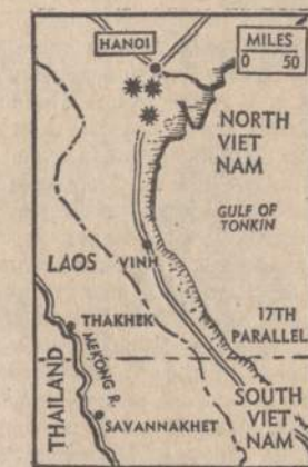
Amerikos laivyno lakūnai išgriovė visai netoli Hanojaus buvusius komunistų radaro centrus. Vėta pastebėti, kad Amerikos lakūnai kiekvieną dieną bombas išmeta vis arčiau komunistų sostinės — Hanojaus.

CANBERRA. — Australija paskyrė per tarptautinį pinigų fondą 10 milijonų dolerių Indijai paremti. Anksčiau Australija davė Indijai kviečių už 9 mil. dolerių.