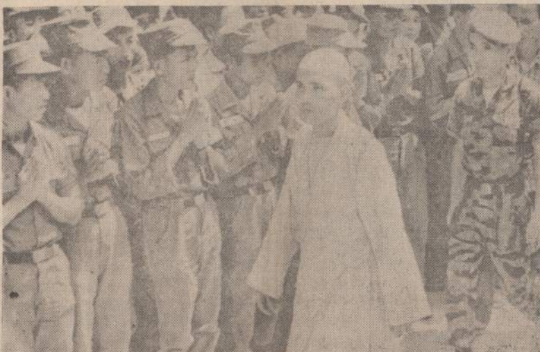
Budistas vienuolis Thich Tri Quang vyksta į Da Nangą, kad patartų vietos karo vadams ir budistų agitatoriams nurimti ir klausyti valdžios įsakymų. Tikybininkus Vietnamo kariai sutinka maldai sudėtomis rankomis. Tri Quang pirmą kartą kalbasi prieš maršalo Cao Ky valdžią, o dabar savo šalininkams pataria tos valdžios klausyti.

laivų. Goldwaterio nuomone, prezidentas bando patenkinti visus savo kritikus. Jis ir bombarduoja ir, kartu, — nebombarduoja. Dėl naminės politikos sumetimų prezidentas sėdįs ant tvoros.