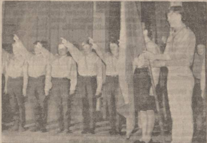
Vasario 16 d. Gimnazijos Vokietijoje LSS "Aušros" tuntu vilkiukai duoda įrodį šv. Kazimiero minėjime kovo 5 d.

Iš kitos pusės, mes laukiame, kad jaunimas būtų atsakomingas, subrendęs, pareigingas. Ne tokiu būdu skiepijamos vertybės veda prie stiprių ir turtingų asmenybių kūrinio. Sunku įsivaizduoti, kaip be subrendusios asmenybės galėtų būti kuriamas ir puoselėjamas lietuvis ar lietuviybė ateinančiose kartose.