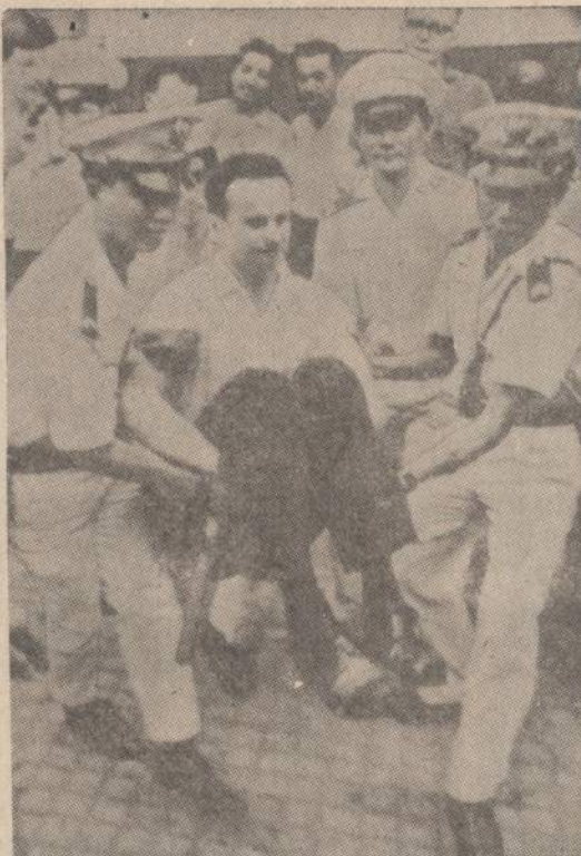
Vietnamo policija suėmė 6 amerikiečius, kurie Saigone pradėjo aiškinti gyventojams apie reikalą nesipriešinti komunistams. Studentai apmėtė tuos "taikos apaštalus" žaliais klausiniais, o vėliau policija išnešė juos iš salės, nuvežė į aerodromą ir išsiuntė į Hongkongą.