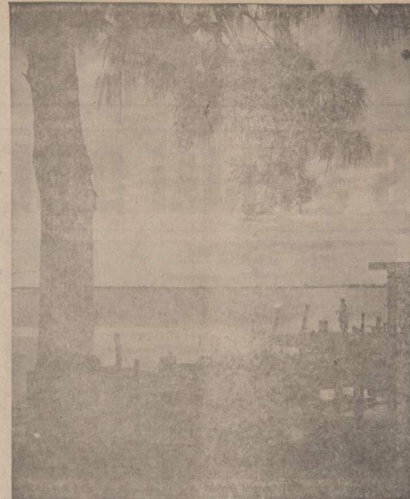
Gražus Floridos saulėlydžio vaizdas. Vakaris Floridos pakrautyje kyja vėjelis, kuris gaivina ne tik meškeriotojus, bet visus šio gražaus pakraščio gyventojus

Minėtoji 157 asmenų grupė akys buvo pakenktos negalutinai — regenos drumstumai ir nuolatiniai randai nebūtinai vi-sada galėjo pakenkti matomu-mui. Kitoj minėtoji 7,607 žmo-