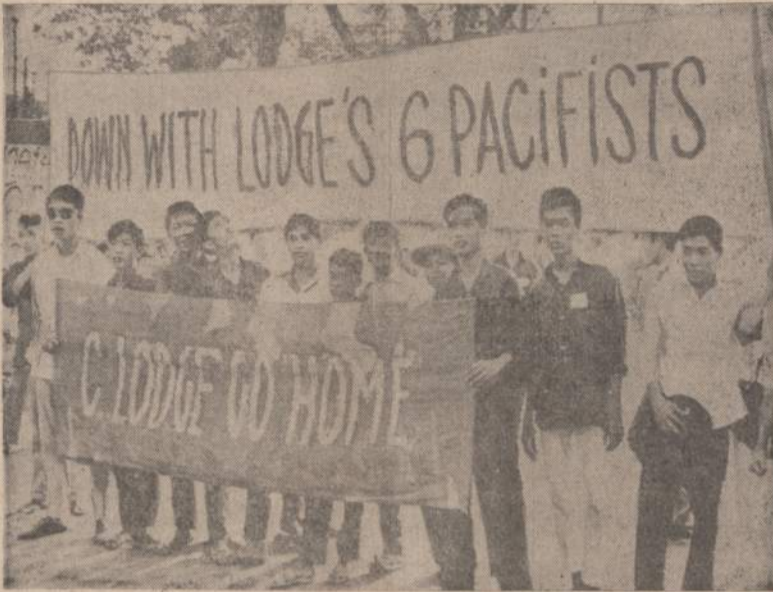
Iki šio mėto Vietname daugumoje protestavo budistų jaunimas, bet dabar į protesto demonstracijas siunčiami ir katalikų vaikai. Pavojaus matome katalikų vaikus, reikalaujančius, kad ambasadorius Cabot Lodge važiuotų namo.