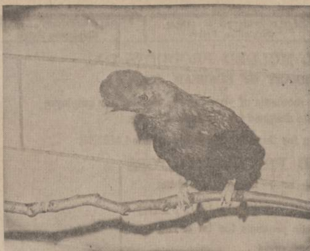
SKARLATINIS KALNŲ GAIDYS "RUPICOLA PERUVIANA"