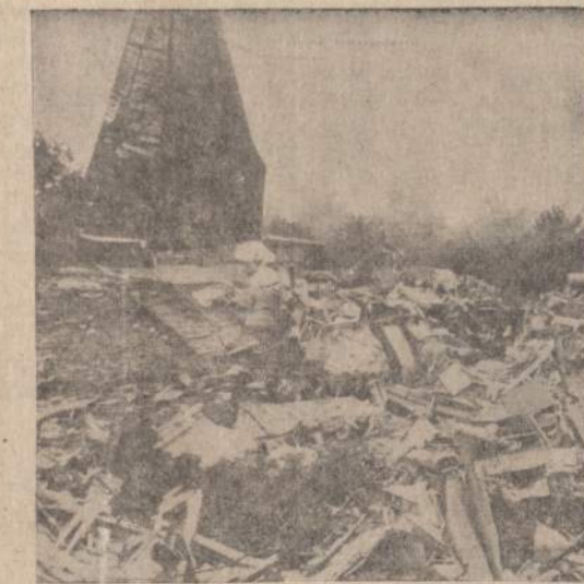
Ardmore, Okla., keliaivinio lėktuvo nelaimėje žuvo 81 karys. Iš Kalfornijos 98 apmokyti lakūnai skrido į Georgia. Elektra lėktuvas, bandydamas nusileisti Ardmore, Okla., aerodrome, sudužo ir užsimušė 81 karys. Policija tyrinėja nelaimės priežastis. Surasta įrašymo mašina. Tyrinėtojų rūpi, ar kartais nelaimė nevyko dėl sabotažo.