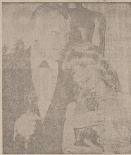
Artistai Lee Marvin ir Julie Christie pripažinti geriausiais praeity metų artistais. Jiems įteikti "oskarai" — gero vaidinimo simboliai.