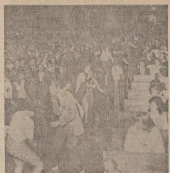
Modernus kunigas senoje Bostono bažnyčioje jau leido šokti pa-gelis tikinčiųjų klauisia, ar tokiems tikimams bažnyčios buvo statytos.

SKAITYK PATS IR PARAGINK KITOS SKAIYTI NAUJIENAS