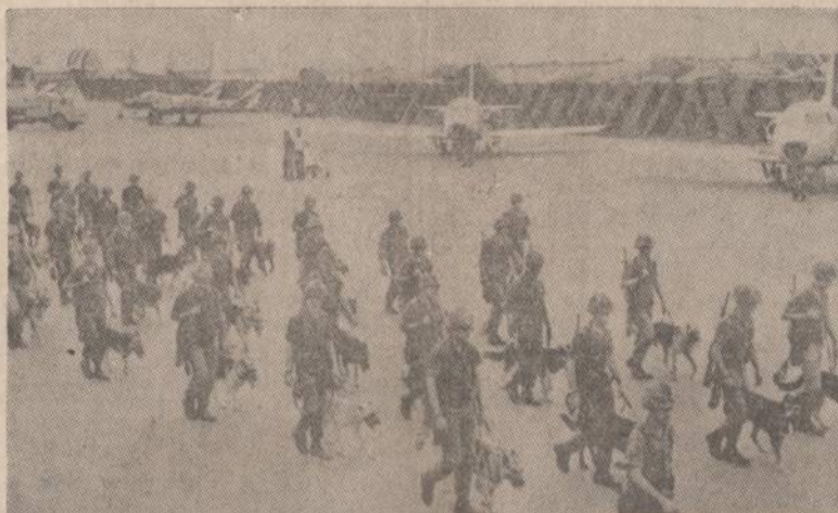
Balandžio pradžioje komunistai apšaudė netoli Saigono esantį Tan Son Nhut aerodromą. Dabar aerodromo sritį saugojantieji kariai turi šunis, kurie anksčiau pajus artėjantį priešą. Paveiksle matome šunis vedančius sargybinius.

Ji pabrėžė, kad jos vyriausybė neketina pasitraukti nuo įprastos Indijos nesikišimo ir neutralumo politikos. Ji Indijos niekam negalvojanči "parduoti" ir kas taip sako, — kalba neties.