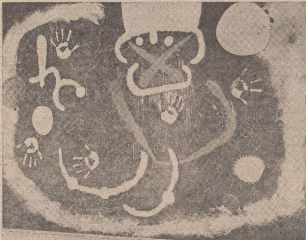
"Šviesa danguje neša mums viltį" — taip pavadintas Joan Miro paveikslas. Šis paveikslas pasirodė menininko 50 metų sukaktuvinėje parodoje.

Žmonės išsigandę į prikaltus (Nukelta į 5 psl.)