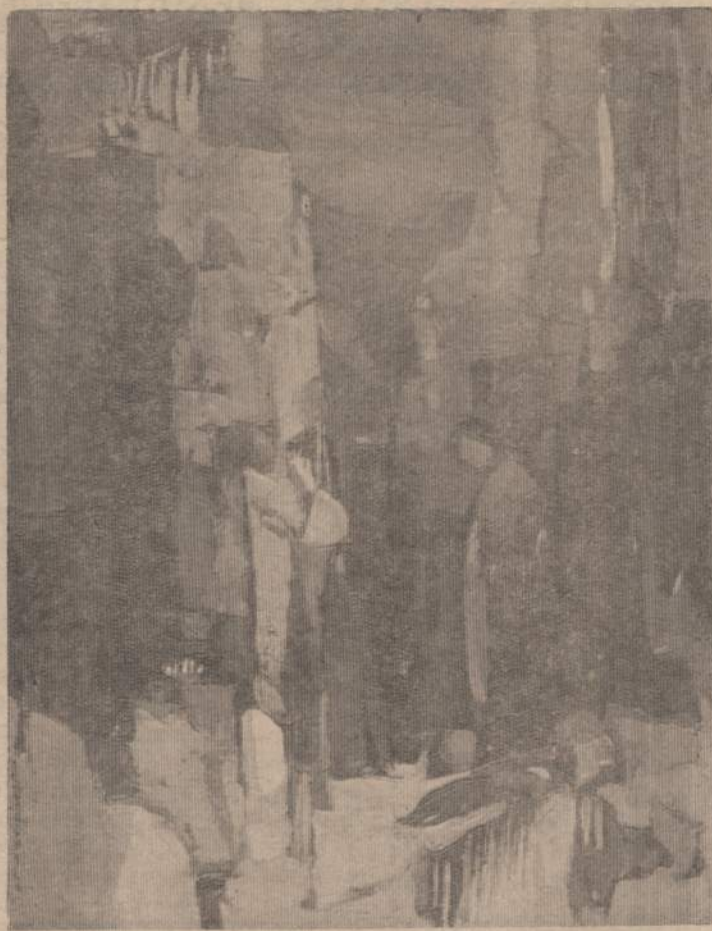
Dail. sesuo M. Mercedes "Dievo pilgrimai" (iš dab. meno parodos "69" meno galerijoje Chicagoje)

Negalima praeiti nepaminėjus dar vieno būdingo dailininkės Mercedes kūrinio, tai "Dievo pilgrimų" nr. 3 (al.) (žiūr. reprodukciją). Šis kūrinys pusiau realistinis ir pusiau abstraktinis. Geroji jo pusė ne ta,