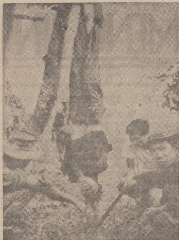
Vietnamo pusėje kovojantiems kiniečiams pavyko paimti nelaisvės komunistą. Jis atsisakė teikti žinias apie save ir savo dalinį. Kiniečiai parišo kojas į viršų ir tesė klausinėjimą.

Pažymėtina, kad "Daily Telegraph" korespondentas Lietuvą ir Estiją vadina Baltijos valstybėmis (Baltic States), o ne taip, kaip norėtų okupantas. J. V.