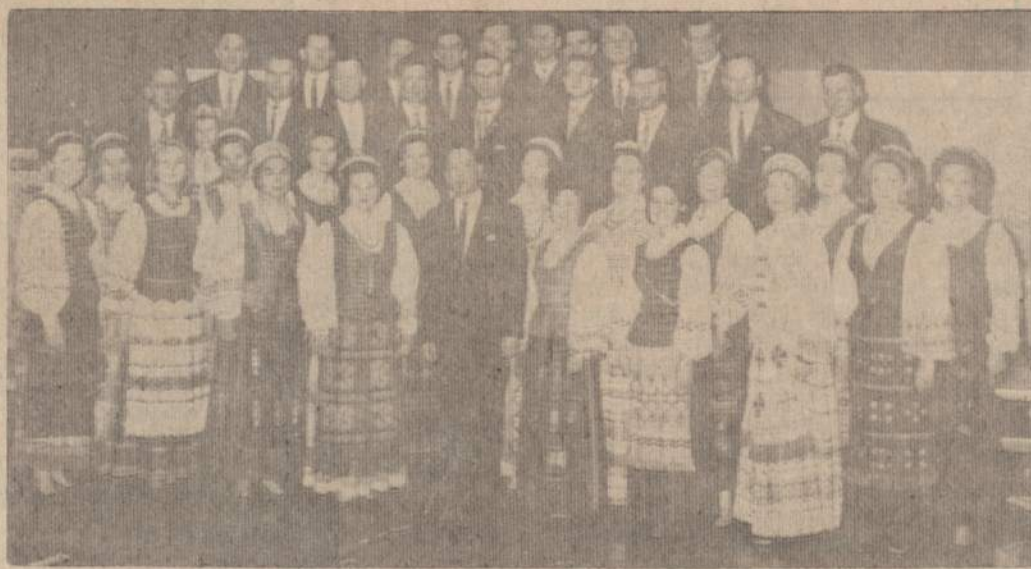
Detroito Lietuvių Šv. Antano parapijos choras

Detroito lietuviai yra nuosirdūs Chicago lietuvių kaimynai. Įvairių operų ar didesnių parengimų metu detroitieškiai visais keliais plaukia Chicago. Tomis pat mintimis jie gyvena ir artėjančią Dainų šventę. Jie skaitlin-