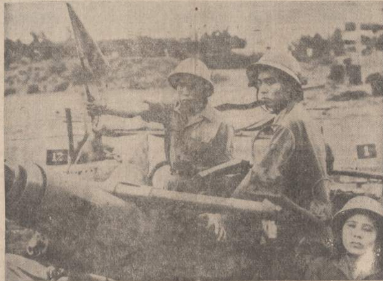
Tai oficiali Maskvos Tass žinių agentūros nutrauka, kuri parodo Haiphongo, šiaurės Vietnamo, moterų priešlėktuvinę komandą.

traukimas iš Nato. Vakarų Europos uostai būtų lengviau prieinami sovietų povandeniniams laivams