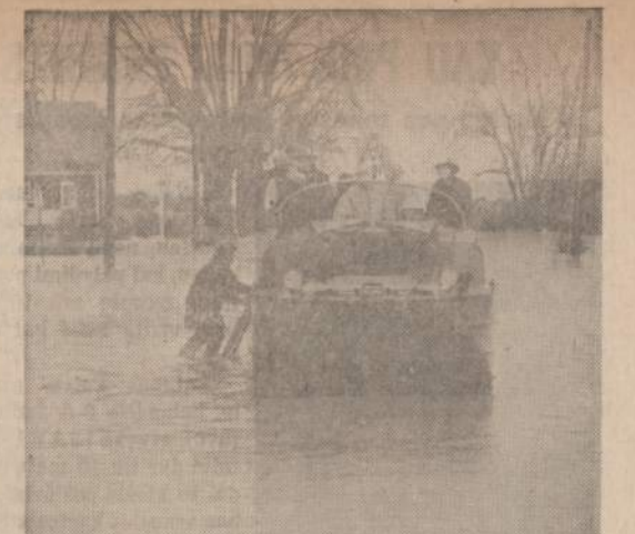
Pakilusios Erie (Ežero bangos užliejo Toledo, Ohio, miesto gatves. Šimtai gyventojų turėjo palikti praežerę apsemtus savo namus ir ieškoti prieglaudų aukštesnėse miesto vietose.

Įtikinantis buvo ir miesto apšvarinimo (garbage refusal) planas. Pasirodo, tenka iš viso miesto su priemiesčiais pašalinti milijonus kubinių jardų sąslavų — atmatų (garbage), kurioms sudeginti reikalingi milžiniški incineratoriai, tačiau miestui augant turimų priemonių jau nebepakanka. Greitu laiku reiks statyti du naujus incineratorius, kurie kaštuos $13,600,000, o specialus