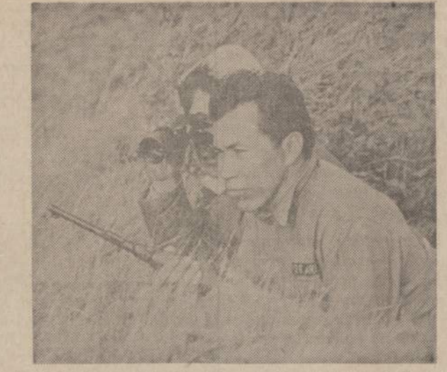
Multininkai saugo Columbia upės pakraščius, kad vietos indėnai uždraustu laiku netiesių tinklų ir neįžūninkytų kiekvieną metą vis mažėjančių žuvų. Valdžia leidžia žuvalti tikrai rudenį ir žiemą, bet ne neršties metu.

Vakaruškos: Pirmadieniais 7 v. v. Tel.: HEmlock 4-2413 7159 So. MAPLEWOOD AVE. CHICAGO, ILL. 60629