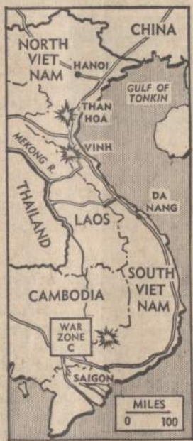
Didieji Amerikos karo lėktuvai bombardavo Vietnamo komunistų karo sandėlius. Galingos bombos išmestos žvaigždžių nurodytose vietose. Komunistai bandė pradėti stiprų puolimą dar prieš lietaus sezoną, bet amerikiečiai bando sunaikinti karo medžiagos sandėlius ir užverstį keluose sukrautas atsargas.

Čikagos Washingtono Parko kūtėse kilus gaisrui sudegė keturi arkliai, kurie vertinami 50,000 dolerių.