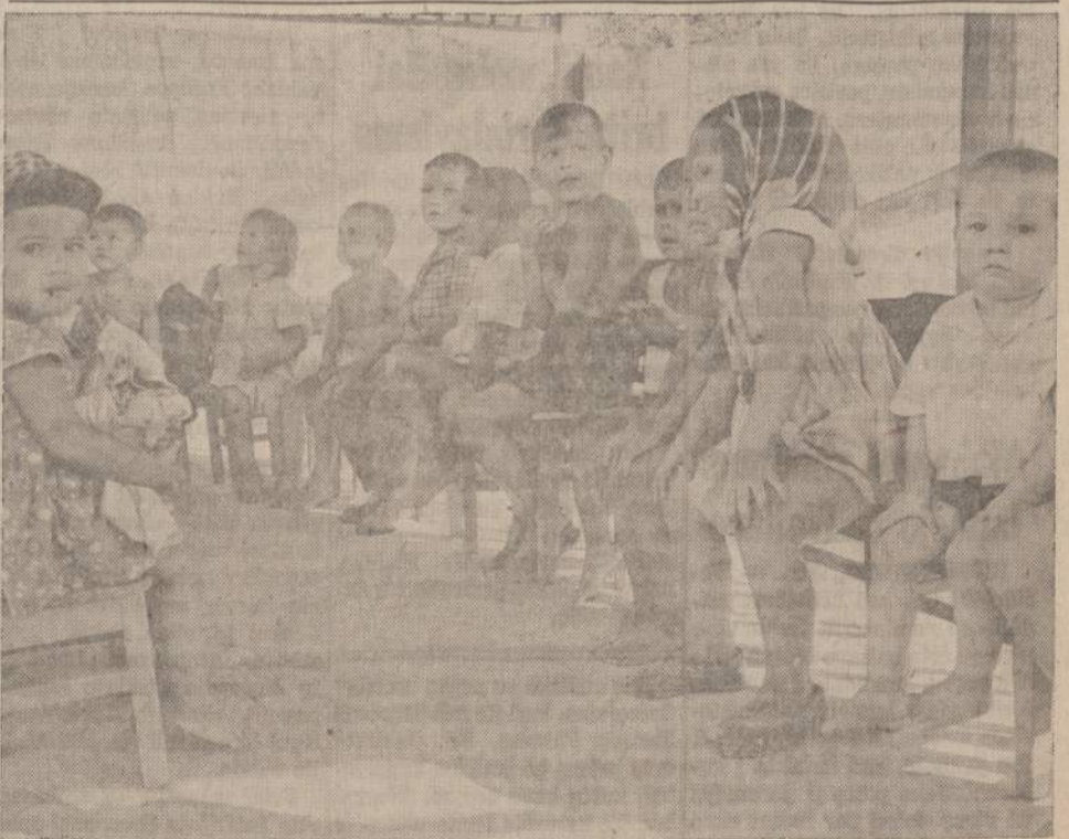
Kinijos pasienyje yra sovietiška uzbekų respublika. Paveiksle matome tos respublikos gyventojų vaikus, besimokančius "vaikų darželyje". Iš paveikslu matyti, kad vienai vaikui į mokyklą eina basi, o kiti nešioja labai didelius batus.

"NAUJIENOS" 1739 So. Halsted St., Chicago, ILL. 60608