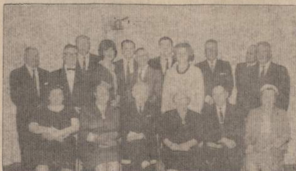
Los Angeles, vasario 27 d. įvyko Lietuvių Demokrato Klubo metinis narių susirinkimas.

— O tu dabar ką! — įsižeidė kaimynas. — Tik mano asilu, o manim ne?