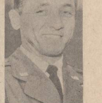
Komunistų nelaisvėn patekęs JAV aviacijos pulk. Robinson Risner. Komunistų propagandos įstaigos skelbia, kad pulk. Risner pagyręs jų pasiryžimą tęsti kovą.

LONDONAS. — Britanijos eksportai į šiaurės Ameriką palyginus su praėjusiais metais padidėjo 20%.