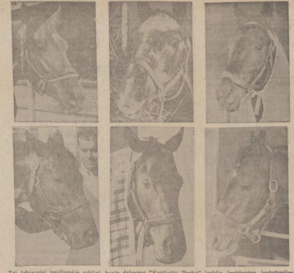
Tai labiausiai pasižymėję arkliai, kurie dalyvavo "Kentucky Derby" (arklių lenktynėse, įvykstančiose Louisville, Ky.). Arkliai vardu (viršuje iš kairės į dešinę): Kauai King, Exhibitionist ir Stupendous; žemai - Tragniew, Abe's Hope ir Amberoid.