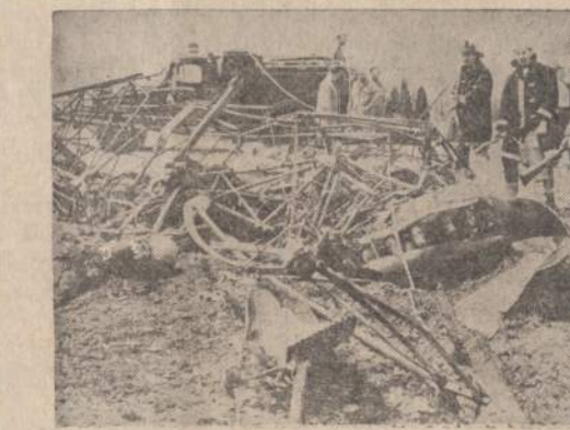
Pottstown, Pa., padangėse žuvo penki parašutininkai ir lakūnas. Iš New Hanover Airport pakilęs lėktuvas sprogo ir visus šešis užmušė. Gyvas liko tik vienas parašutininkas, kuris sugebėjo išristi iš krintančio lėktuvo 300 pėdų aukštumoje ir parašutu nusileido.

PARYŽIUS. — Prezidentas de Gaulle pergalės prieš nacių Vokietiją dienos proga padėjo vainiką prie Paryžiaus Nežinomojo Kareivio kapo. Iškilėse dalyvavo Nato pajėgų vyriausias vadovas generolas Lyman Lemnitzer ir Nato generalinis sekretorius Manlio Brosio.