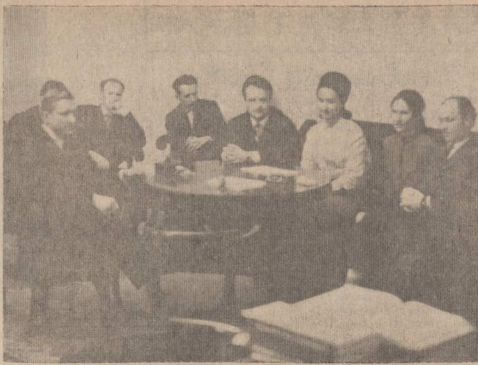
Charles H. Percy (kairėj) balandžio mėnesį besilankydamas Vilniuje, užsako į Vilniaus Universitetą ir kalbėjosi su okupanto primetu prorektoriumi bei keliais studentais. Visos p. Percy kalbos buvo įrekerduotos, kad vėliau nekiltų nesupratimų. Spaudos atstovams p. Percy pareiškė, kad jis nesimaitė nei su vienu okupacinės valdžios atstovu, nes JAV nepripažįsta sovietinės okupacijos Lietuvoje.

Cia, tremtyje ar iševijoję džiaugiamės, išsprukę iš siau-