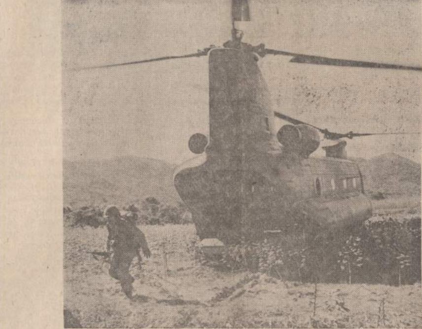
Vienas iš mižiniškų Chinook maūnsparnių (helikopteriu), kurie yra naudojami Vietname kariams gabanti.

POTTSTOWN, Pa. — Nukritus ir sudužus lėktuvui užsimušė šeši parašutininkai — mėgėjai, kurie buvo pasiruošę šokimo iš lėktuvo varžyboms. Vienas lėktuve buvusių spėjo iššokti ir laimingai nusileisti su parašutu.