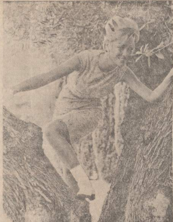
Kino artistės ir šokėjos ant medžių nesuga, bet kartais jos į medžius ilipa. Paveiksle matome Mitzi Gaynor, ilipusią į dvisakį medį.

daryti. Susirinkusieji nutarė į kovą su kriminalu įtraukti ir kitų keturių Gary aukšt. mokyklų mokinius. Mokinių sumanymą remia Gary Junior Chamber of Commerce.