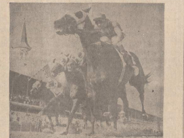
Churchill Downs, Ky., arklių lenktynės laimėjo "Kauay King" arklys. Paveikslo rodo, kaip jis paskutinę minutę sugebėjo prasižveržti pirmyn ir padaryti laimingais šimtą tūkstančių žmonių, patikėjusių jo laimėjimu. Antrasis arklys vadinas "Advocator", trečiasis "Blue Skyer", o penktoji vieta atiteko "Ave's Hope" arkliui.

MACHINE OPERATORS • HELI-ARC WELDERS • BRAKE-PRESS, SET-UP AND OPERATE • POWER SHEAR, SET-UP AND OPERATE Top pay for qualified men, steady work, Company benefits. CALUMET MFG. CO. 6550 N. CLARK ST. SH 3-2442