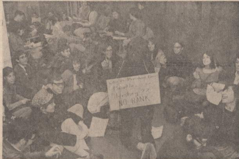
Maža Chicago Universiteto studentų grupė, iš 6,000 tik 300, protestuoja prieš universiteto vadovybės nutarimą teikti laipsnius naujokų šaukimo komisijai, jeigu studentas sutiks. Jie nori, kad jokios žinios nebūtų teikiamos.

Praėjusią savaitę vėl daugiau amerikiečių žuvo negu vietnamiečių. Amerikiečiai turėjo 82 užmuštus ir 615 sužeistus, o vietnamiečiai 61 užmuštą, 154 sužeistus ir 22 dingusius.