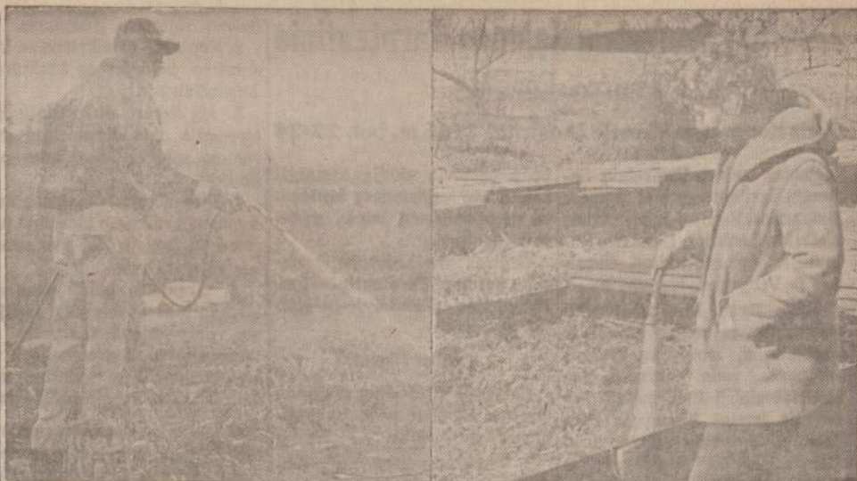
Amerikos ūkininkams žalias oras, sniegas ir lietus padarė didelių nuostolių. Kairėje Leesville, N. C., ūkininkas laisto tomėčių daigus, kad atšiltų ledai, o kairėje St. Joseph, Mich., šilaiti apsiręngusi moteris laisto tomėčių daigus.

gotis atvykstančių iš už Geležinės Uždangos "parlamentarų" bei "kultūrininkų", jau nekabant apie atvirus komunistų partijos narius ir valdžios pareigūnus.