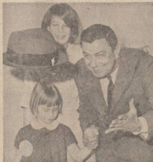
Franklin D. Roosevelt Jr., įgarsėjusio prezidento sūnus, pareiškė, kad jis bus demokrato partijos kandidatas į New Yorko gubernatoriaus. Kartu nufotografuotos dvi kandidato dukterys.

SAN FRANCISCO. — Amerikos administracija leido vienam sovietų žvejų laivui įplaukti į Drakes Bay uostą Kalifornijoje pasitaitysi sugedusį motorą.