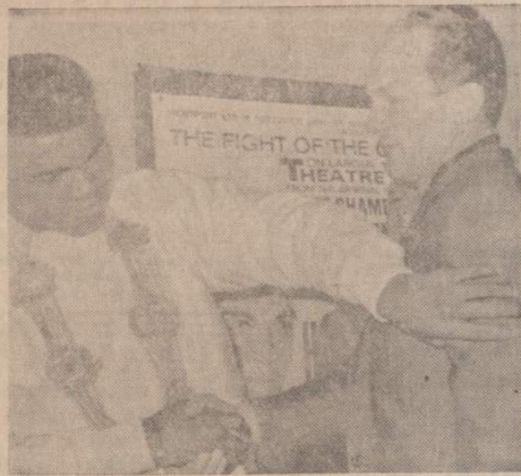
Sunkaus svorio žemponas Cassius Clay gegužės 21 dieną Londone rungtis su britų boksininku Henry Cooper. Clay tikrina Cooperio raumenis.