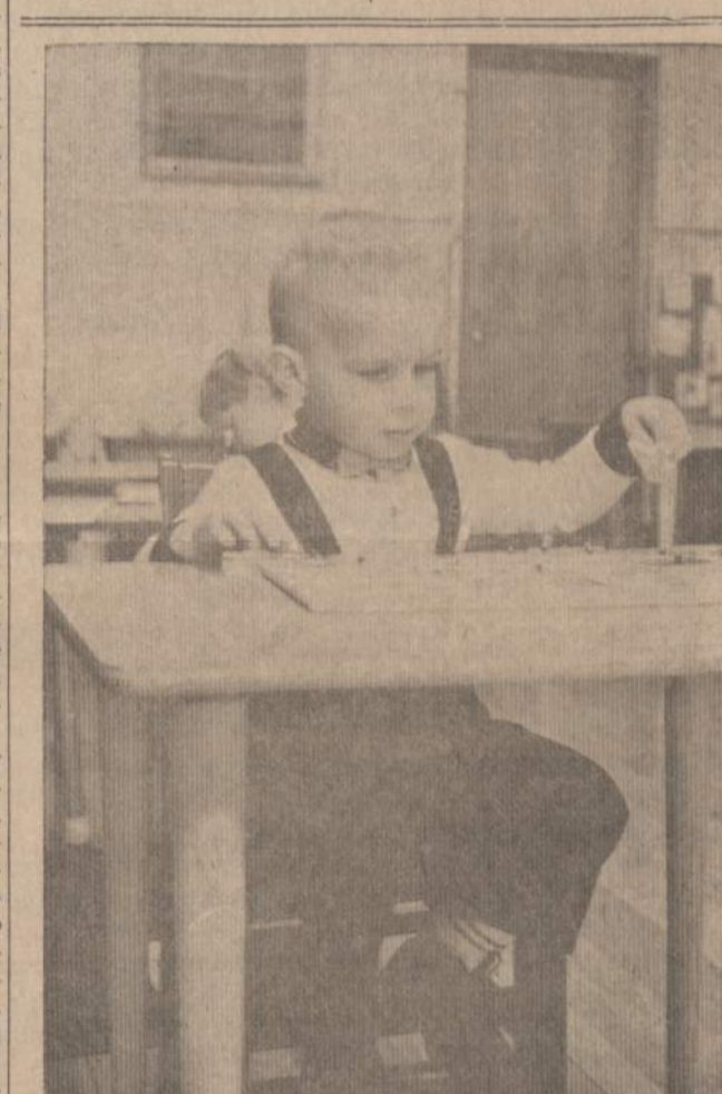
Susipažinimas su formos savoka. Amerikos Lietuvių Montessori Draugijos Vaikų Namelių mokinukas susikaupęs įsiekio vietos gyvuliuko formai atitinkamai išpaustytoje lentoje.

● Jeigu žmonių kalbą būtų galima paversti elektros energija, tai penkis moterys apsviestų visą miestą.