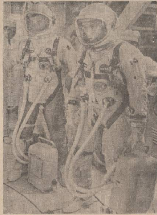
Gegužio 17 d. astronautai Eugene Cernan (kairėje) ir Thomas Stafford (dešinė) pakils į erdvę. Į erdę bus paleistas jų erdvėlaivis ir Agena raketė.