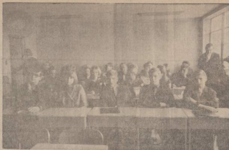
LJS Vadovų Kursų jaunieji klausytojai kursų paskaitų metu.

Būtina atsiminti, kad savo dvasinės būsenos užskleidimas tėvams ir ieškojimas patarimo tik pas savo draugus, jau yra vaiko nelaimių pradžia, o taip pat ir visos šeimos nelaimė. (Jei jau skauto šeimoje yra susidaręs tokios neigiamos psichologinės sąlygos, — jis neturi galimybių būti atviras savo tėvams. Skautas turi atsiminti turįs savo draugininką — savo nuoširdų vyresnį broį ir tuo patim jau išmintingesnį, arba turtininką — suaugusį broį, skau-