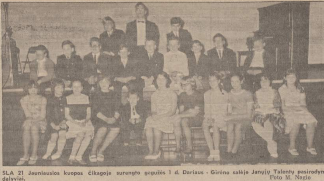
SLA 21 Jauniausios kuopos Čikagoje surengto gegužės 1 d. Dariaus - Girėno salėje Janųjų Talentų pasirodymo dalyviai.

SKAITYK PATS IR PARAGINK KITOS SKAITYTI NAUJIENAS