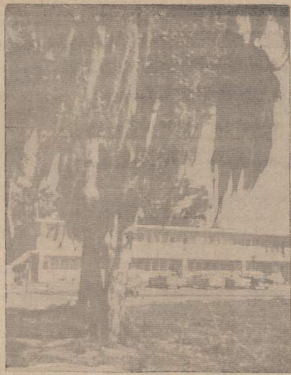
Taip atrodo barzdotas medis Floridoje.

Nežinia, kiek toli tas įkuras parazititas yra išsiplatinęs į vakarus, jei dar Kalifornijos nepa-