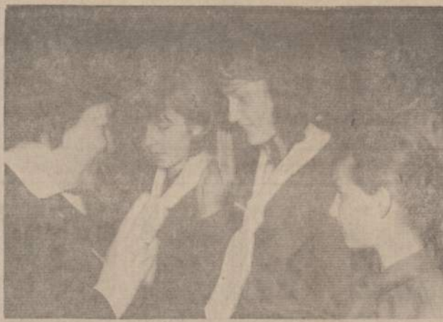
PIRMIEJI KAKLARAŠČIAI RUGIAGELIŲ SKILTĮ

Visi mes esame pakeičiami ir progresas vyksta įsijungiant miklesnėms rankoms, aštresniems protams. Keitimasis pareigomis išaugina didesnę skautų potencialių LSS ir LSB va-