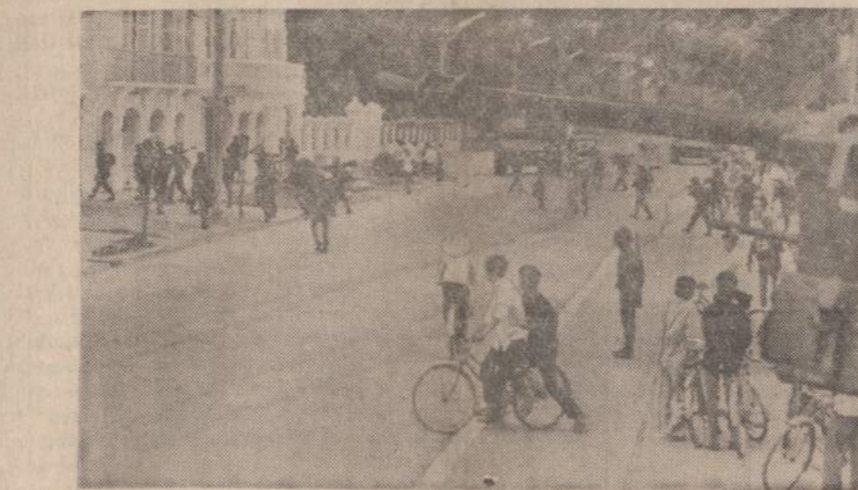
Vietnamo vyriausybės daliniai, saugojami galinu tanku, eina į Da Nang savivaldybę, kad pašalintų sukilėlius tarnaujantį burmistrą ir kitus pareigūnus. Da Nango mieste Vietnamo kariai užėmė radijo stotį, uosta, savivaldybę ir kitas strategines vietas. Paliko likti budistų pagoda, kurioje koncentruojasi fanatiškų budistų vadai ir jiems pritarantieji kariai. Vyriausybei ištikimi tankai ir mariniai labai lengvai gali nuginkluoti su komunistais bendradarbiaujančius budistus.

Sovietų Sąjunga paskutinius savo kariuomenės dalinius iš Rumunijos atsiėmė 1988 metais. Ji tačiau dar turi Rytų Vokietijoje net 24 divizijas, Vengrijoje 5 divizijas, o Lenkijoje apie 20,000 kariuomenės.