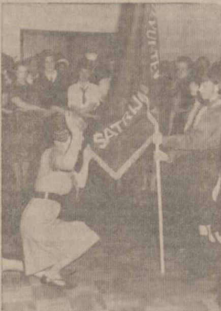
PO SKAUTININKĖS ĮJODŽIO