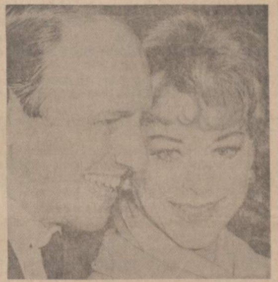
Kino artistė Hedy Lamarr, laimėjusi bylą prisiekusiųjų teisme, dabar traukia atsakomybę krautuve už neteisingą bylos iškeitimą ir reikalauja penkių tūkstančių dolerių. Ta byla pakenkusi josios ki-no artistės karjerai.