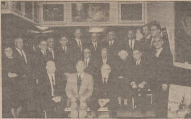
Balfo Marquette Parko 5 skyriaus valdyba, kontrolės komisija ir seniūnai, kurie labai sėkmingai pradėdė rudens vaju 1965 m.