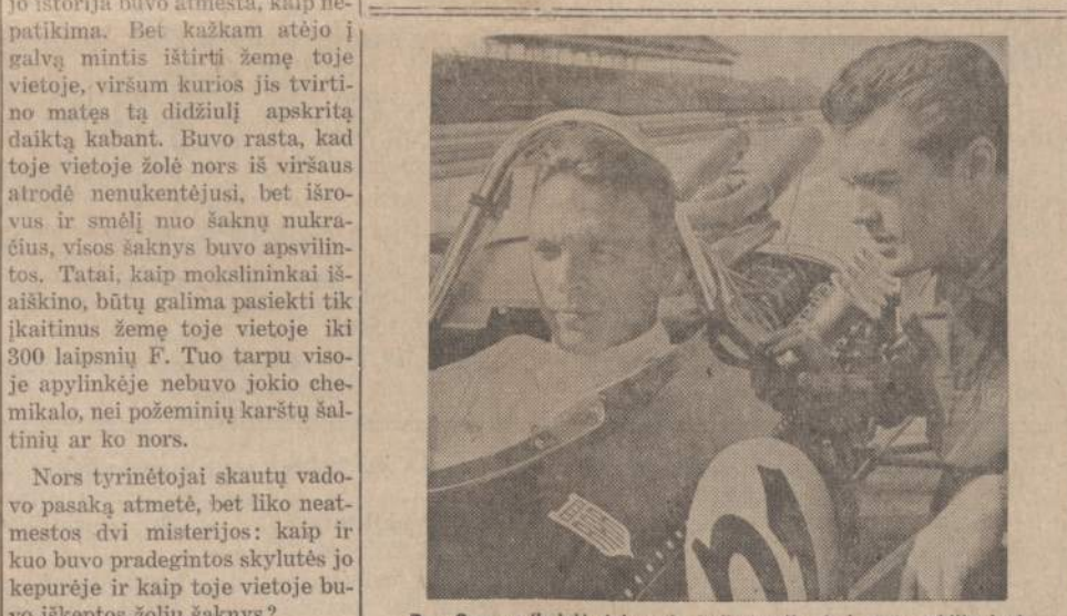
Dan Gurney (kairė) dalyvauja Indianapolis, Ind., automobilių lenktynėse. Daugelis mano, kad jis gali laimėti 500 mylių lenktynes. Patarimus jam duoda Craig Breedlove, Utah lygumose nuvažiavęs 600 mylių.