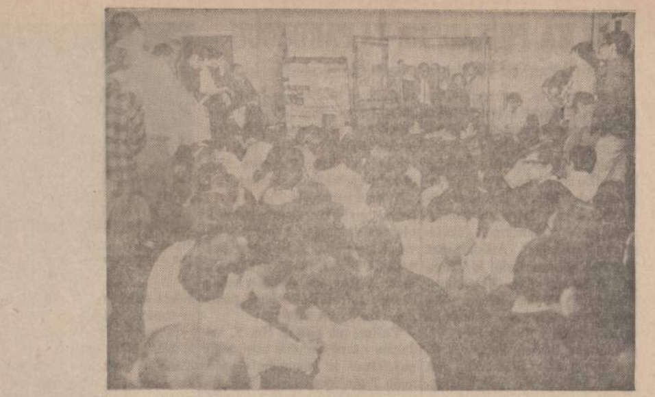
Chicagoje Universiteto studentai, susirinkę ties universiteto administracijos namais, protestuoja prieš studentų šaukimo karą tarnybon.

Galima neabejot, kad rumunai veikia ir su kitų Maskvos satelitų pritarimu. Maskvos raudonarmiečiams teks nešdinti lauk iš visų svetimų žemių — pagaliau, ir iš Lietuvos.