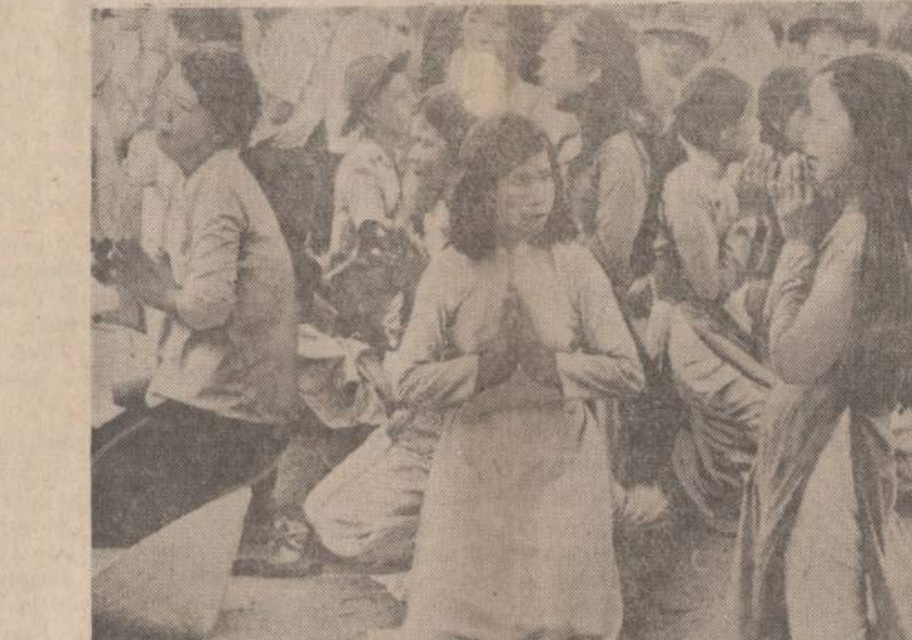
Vienuoliu suaugtuoti budistai susirinko į Da Nango pagodą ir meldžiasi, kad Vietnamo kariuomenė neižengtų į maldyklą. Jeigu valdžia imtųsi tokio žingsnio, tai tikintieji mano, kad prasidėtų pilietinis karas.

MANILA. — Audroje dingo keleivinis Filipinų laivas su 262 keleiviais. Iš jų 136 buvo rasti mažoje Bantayan saloje gyvi. Kas atsitiko su likusiais — nežinia. LONDONAS. — Austrijos prezidentas Franz Jonas buvo iškilmingai sutiktas Britanijoje, kur jis viešės 5 dienas.