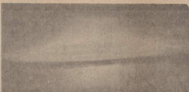
Tipinga "skraidančioji lėkštė", kaip dažniausiai matoma, panaši į dvi priešais sudėtos lėkštės, neaiškiais lyg migla aptrauktas kraštais su tamsia juosta per vidurį.

Patekęs į žmogaus augimo palmėčių tankumyną, atsisekdamas pagal šiaurės žvaigždę, jis brido ta kryptimi, kur iš kelio matė šviesą. Staiga jis pajuto, kad oras darėsi karštesnis. Pagaliau išlindęs iš palmėčių kamsaties, jis atsidūrė aikštelėje, bet čia buvo tiek karšta, kad sunku darėsi kvėpuoti. Norėjo atsisekti, bet kai pažvelgė aukštyn, kur šiaurės žvaigždė, tai viršų apie kokias 30 pėdų aukščio dangų dengė kažkoks apskritas dangtis ar stogas. Atsokęs keletą žingsnių jis pajuto, kad karštis sumažėjo ir elektros lemputė pa-