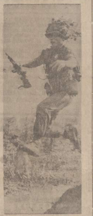
Pietų Vietnamo pėstininkas šoka per upelį. Kariai paskirti saugoti kelius į Saigoną. Vietomis komunistai prie kelių neprieina, bet kitose vietose jie pajėgia išsproginti tiltus ir užpuolti keleivius.