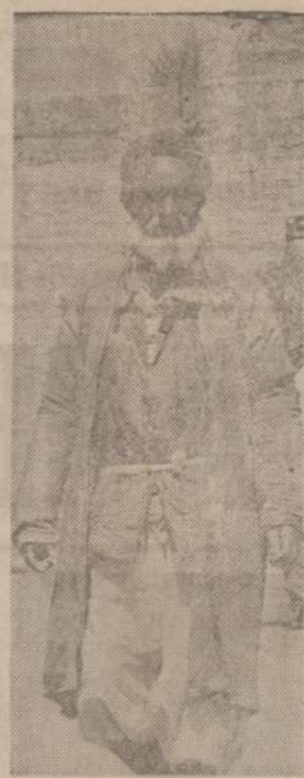
Šiandieninis sovietų Uzbekistano gyventojas dėvi tuos pačius drabužius, kokius uzbekistanečiai dėvėjo Džingis Chano laikais. Atrodo, kad jų ir darbo metodai tie patys.