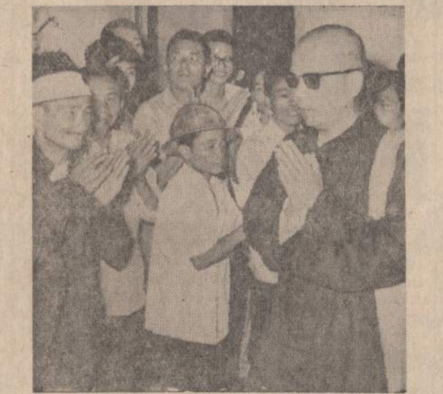
Komunistuojantis budistų vadas Thien Minh prisiekė kovoti iki mirties prieš premjero Ky vyriausybę, drisusią pasiųsti kariuomenės dalinius į Da Nang miestą.

◆ Atominės Energijos komisija paskelbė, kad paskutinė Kinijoje išsprogdinta bomba buvo galingesnė, negu iš pradžių galvota. Jos dydis siekia apie 1 milijoną tonų TNT.