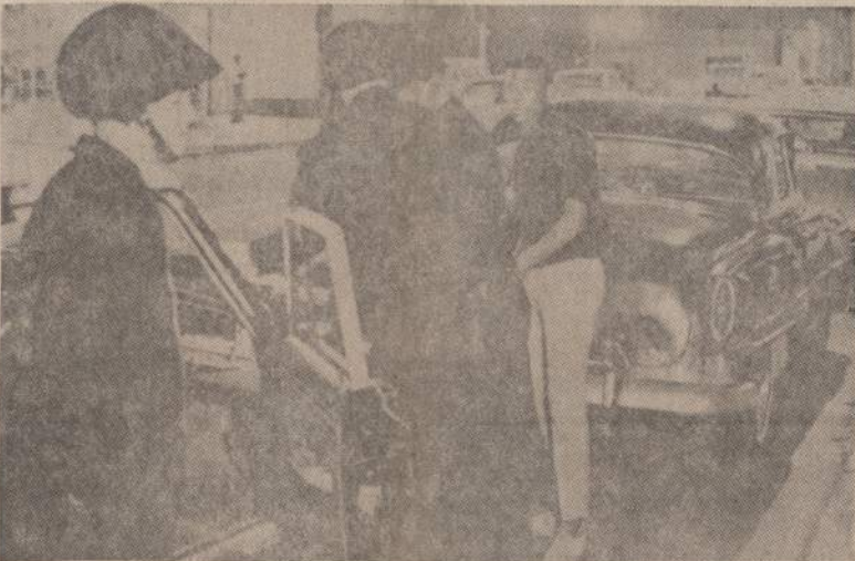
Los Angeles policija viršum baltų šalmų dėvi juodas beretes, kad "snaiperiai" iš pasalų ne taip gerai galėtų pataikyti. Šauti.

Pranešimai apie Da Nango susikirtimų nuostolius yra nevienodi. Reuterio agentūros žiniomis žuvusių skaičius budistų pusėje siekia 215 asmenų, o sužeistų esą 795.