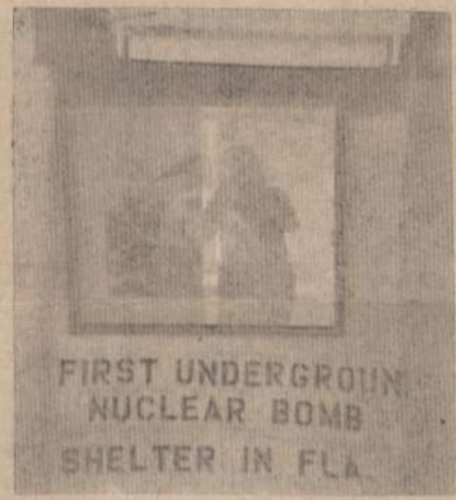
Geriausia ir vienintelė Floridoje vieta meškeriojotams pasigirti laimėjimais, kai žmonos negirdi, tai prov. šešelio "nuo atominio bombų pasislėpti rūšys" su patogiais foteliais, stalais ir galvinais esencijų bonkomis pilnais šaldytuvais.

Įkarštis: Tai yra specifinė meškeriojotų liga, kuria jie apsi-krečia vos pirmiems pavasario ženklams pasirodžius, pradėdami tikrinti meškerkočius, galasti kablukus, šveisti metalinius kilbukus ir skaityti senuose žurnaluose rastas pasakas apie pasakiškas ant meškerės pagautas žuvis.