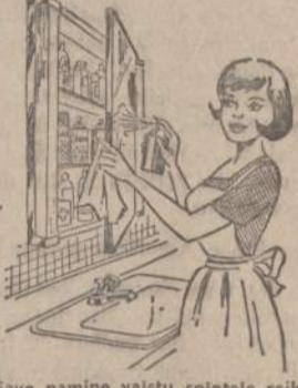
Savo namine valsty spintoje reikia nepaprastai švariai ir tvarkingai užlaikyti, kaip šilame vaizdelyje parodyta: išimti visas bankutes ir išmesti lentynas; patikrinti visus užrašus, kad neįvyktų klaidų, nes valsty sumaišymas gali būti fatališkas, patikrinti, kokių valsty trūksta ir juos papildyti kad būtų bet kokiam netikėtumui pasiruošęs.