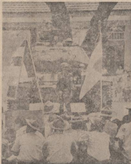
Vietnamo skautai susidėjo su būdistais prieš Ky valdžią ir susėdė skersai gatvės nepraleido tankui pravažiuoti.

ISTANBULAS. — Galinga bomba susprogdino Amerikos bibliotekos pastatą Turkijoje. Sprogimas įvyko nakties metu ir žmonių aukų nebuvo. Bibliotekoje buvo padėtos ir dvi padegamosios bombos. Sargui pavyko ugnį užgesyti, sudegė apie 200 knygų. Turkijos policija įvykį tiria.