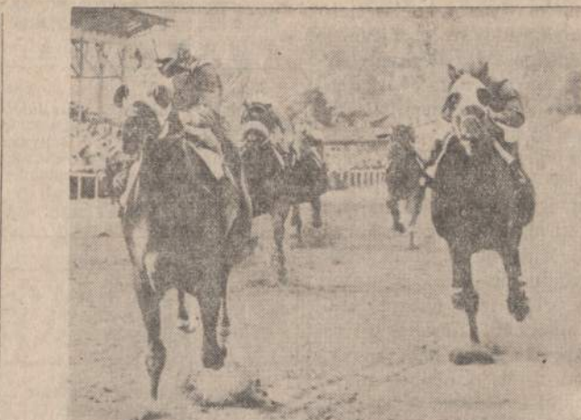
Arkllys Kauai King laimėjo Kentucky lenktynes. Antras greitas arkllys vadinasi Stupendous. Kauai King savininkas laimėjo $119,000. Šis arkllys papildė kišenius tų, kurie juo pasitikėjo.

Pirmadienį buvo pirmoji ši pavasarij tikrai šilta diena su temperatūromis iki 88 laipsnių per visą dieną. Vakarop staiga