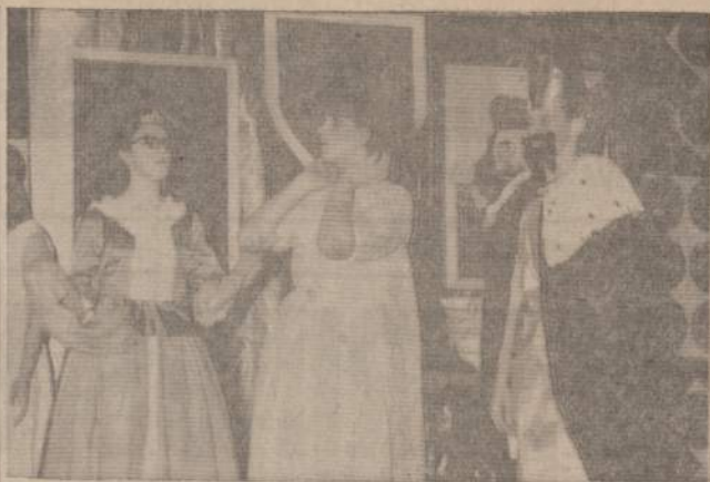
IŠKARPA IS TORONTO "SKAUTORAMOS"

6. Skautams vienetuose ir tėvams būreliuose laiko bėgyje keičiantis, skautų vienetai yra palyginti, ilgaamžės institucijos. Jau emigracijoje daugelis vienetų atsventė 15 ir daugiau metų sukaktis. Pati Lietuvių Skautija artėja prie 50 metų sukakties. Organizacijoje yra daug narių, kurie joje išaugo, subrendo ir užaugino naują skautų kartą. Yra šeimų, kurių dvi generacijos skautuoja ir netrukus gali pradėti skautauti ir trečioji karta. Todėl LSS yra ne vien vaikų organizacija, kurią turėtų globoti kas nors iš šalies. Tais smetimais rėmėjų organizavimo min-