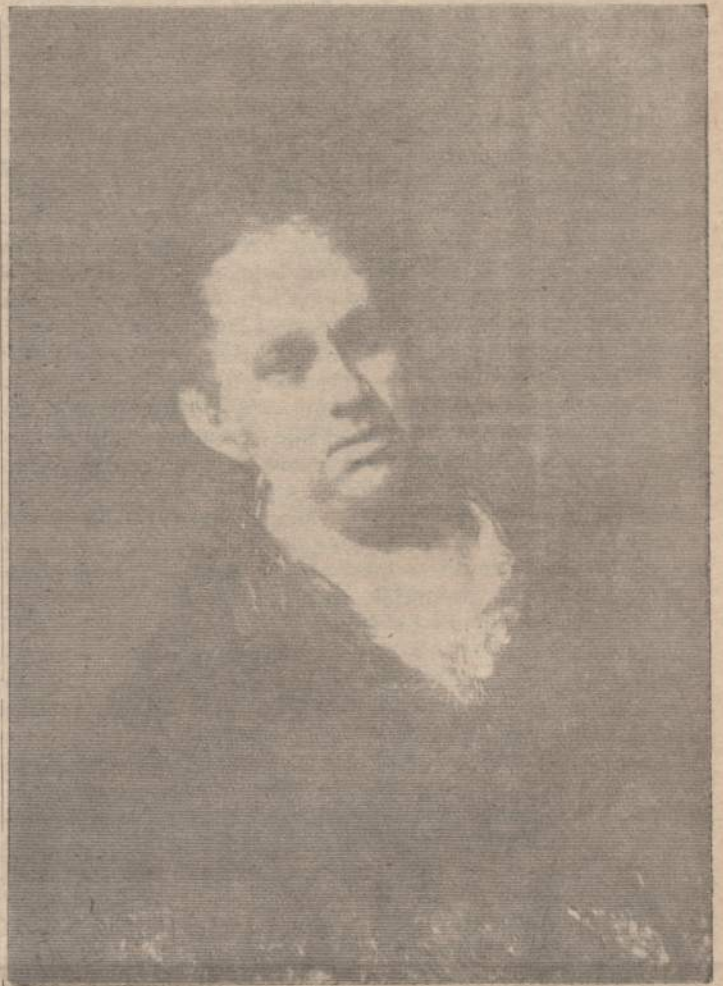
Francisco Goya, ispanas, 1746—1828 (Smith College Museum of Art nuos.)