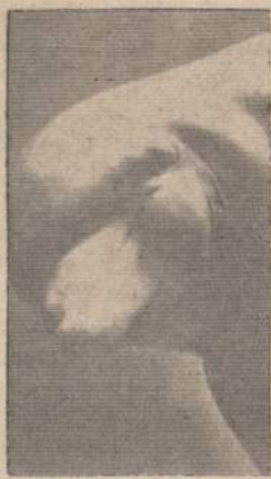
Šelmis. Jis mėgsta gražių moterų kompaniją, kaip galima matyti sekančiame paveiksle.

Susipažinkim arčiau su tvano metu atsiskyrusiais gentainiais