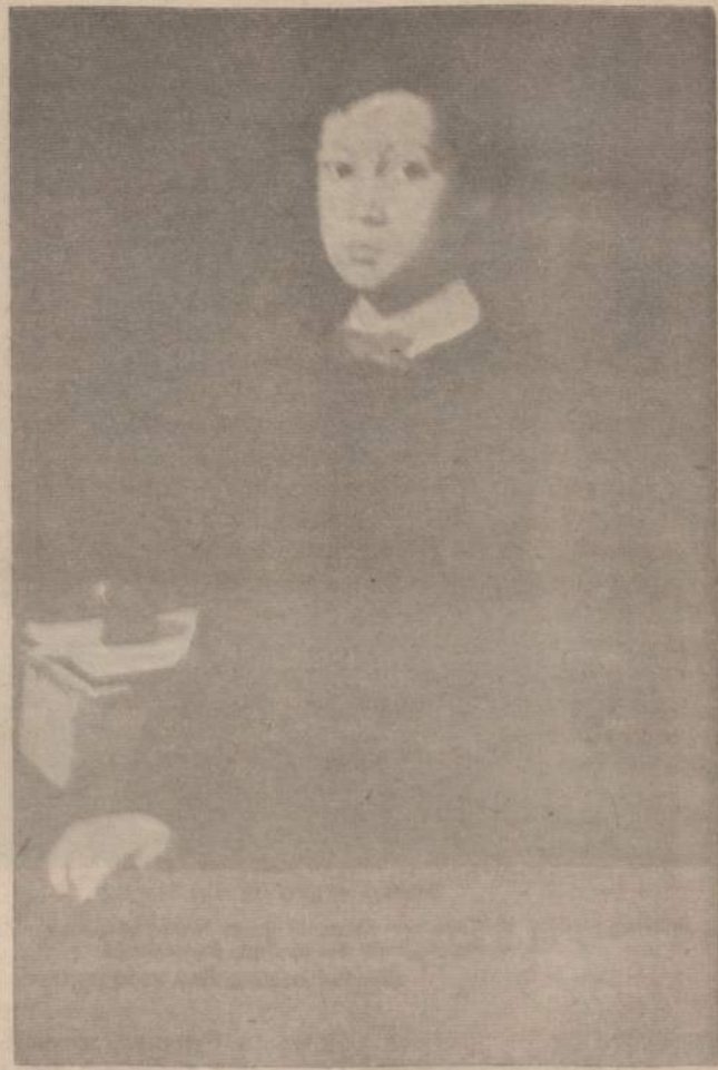
Edgar Degas, prancūzas, 1834—1917