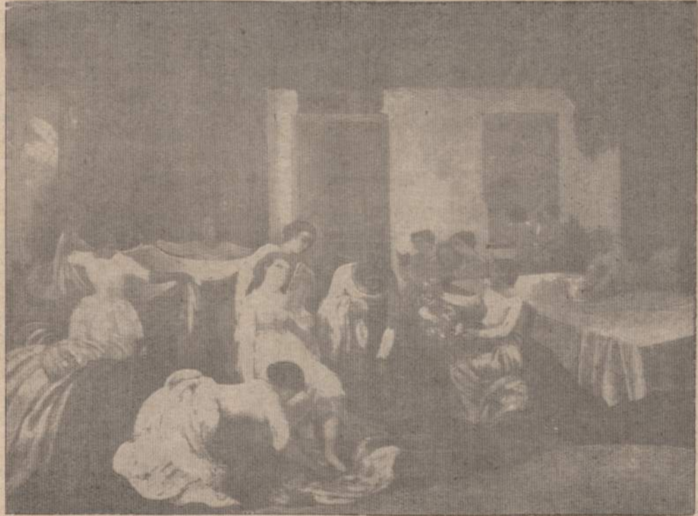
Gustave Courbet, prancūzas, 1819—1877

5 — NAUJIENOS, CHICAGO 8, ILL. — SATURDAY, JUNE 4, 1966