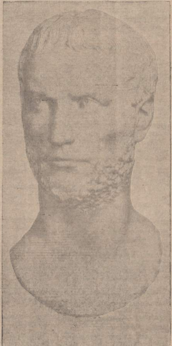
Romos imperatorius Gallienus, 253—268 m. era, biustas

Vienas psichologijos profesorius ilgesnį laiką tyrinėjęs Berkeley, Harvardo bei kitų universitetų nuobirų gyvenimą ir jų psichologiją, sako šį gyvenimą pamėgusių dauguma esanti iš vidutinio turtingumo žmonių klasės. Jų esama nuo "bitniko" tipo iki žvalaus sportininko, mėgstančio jūrų bangomis čiuožti. Tai daugiausiai vieniši žmonės, kurie galvoja, jog turint nakvynei pastogę ir kelis centus užėiti kavinėn, tai jau ir gyvenamas laisvas, nepriklausomas gyvenimas. Ir Berkeley "studentiškoji bohema", kaip ir kituose universitetuose, keičiasi. Vieni tik metus ar dvejus taip pagyvenę pranyksta, bet ilgiausiai tokiu gyvenimu viename mieste išgyvenama apie 3—4 metus. Buvęs prezidentinis kandidatas Barry Goldwater, na-