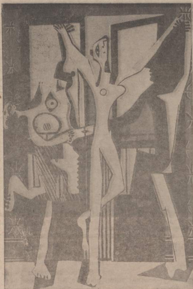
PABLO PICASSO "SOKĖJIOS"