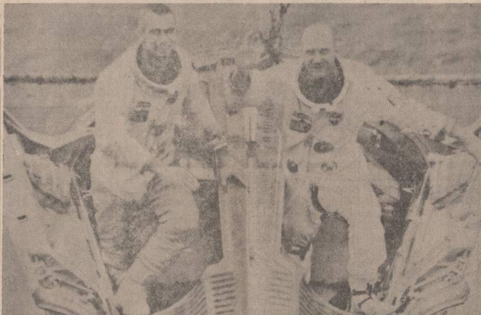
Astronautai Thomas Stafford ir Eugene Cernan turėjo daug klūčių erdvėje, bet įjėdu labai taikliai nusileido. Jų erdvėlaivis Gemini 9 palietė vandenį pusketvirtos mylios atstume nuo lėktuvnesio Wasp. Buvo paruošta ke-liadesimt laivų ir šimtas lėktuvų astronautams surasti, bet pasirošimas buvo bereikalingas. Wasp kapitonas, be žiūronų pastebėjęs krintanti paraišiu į erdvėlaivį, įsakė lėktuvnesiui trauktis atgal. Jis bijojo, kad besilei-diantieji astronautai nepataikytų į laivą.