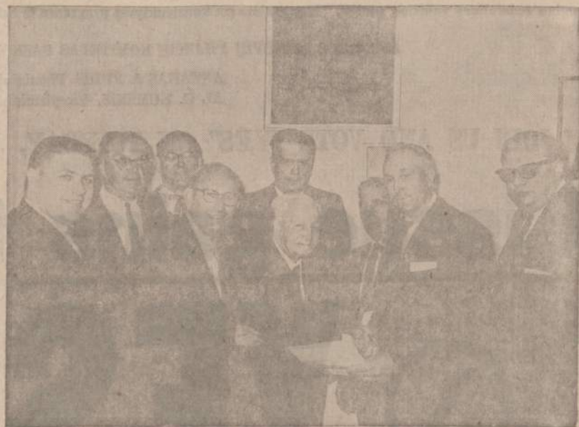
ROSELANDO LIETUVIAI REMIA BARRETT O'HARA