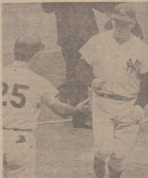
Joe Pepitone sveikina Mickey Mantle, laimingai ir laiku pasiekusį žemę esantį ženklą.

8 — NAUJIENOS, CHICAGO 8, ILL. — SATURDAY, JUNE 11, 1966