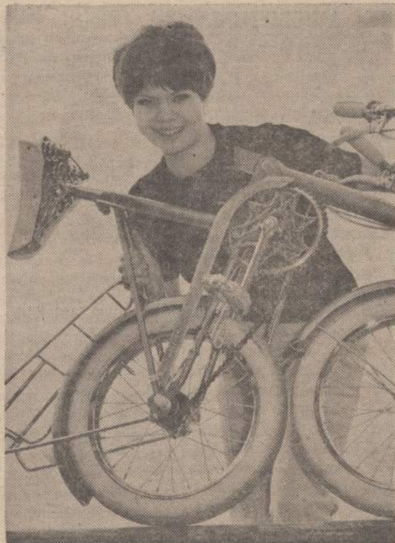
Britai išrado sustumiamą motociklą. Kai važiuotojas privargsta arba motociklas atsisako klausyti, tai jį galima sustumti, kaip paveikslė matoma moteris padarė, įsidėti į automobilio atsarginę ir toliau važiuoti.

CHICAGO SVARIAUSIAS IR MODERNISIAUSIAS DARŽAS BUČO DARŽAS WILLOW WEST INN AND PICNIC GROVE 83rd and Willow Springs Road WILLOW SPRINGS, ILL.