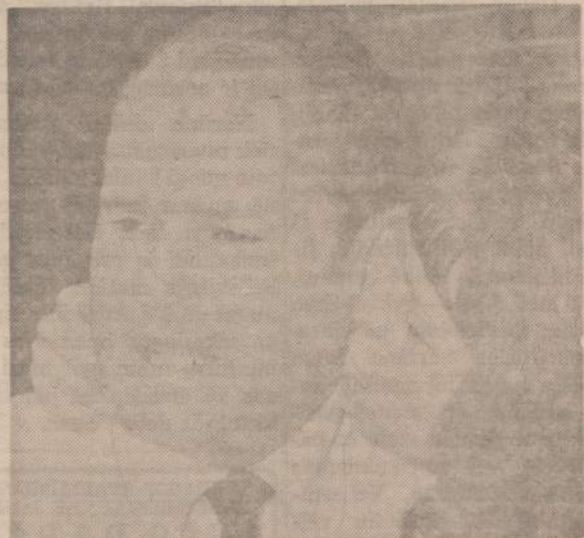
Aukščiausias JAV tribunolas įsakė iš naujo nagrinėti Dr. Samuel Sheppard bylą arba paleisti jį iš kalėjimo. Teismo neriai mano, kad Dr. Sheppard teismas nebuvo bešalus. Dr. Sheppard buvo nuteistas už žmonos nužudymą. Kartu su daktaru džiaugiasi ir naujoji jo žmona vokiečiai.