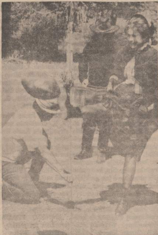
Kino artistė Stephanie Powers spyrė sviedinį, kaip tikra futbolistė. Ji vaidina filme, kuriame žaidimas futbolu užima didoką filmo dalį.