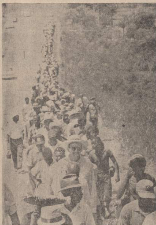
Negrai ir liems pritarantieji baltieji maršuoja Misisipi vieškeliais, reikalaudami užregistruoti visą ašalį negrų, turinčių teisę balsuoti, bet neįrašyti į rinkiminius sąrašus.

◆ Sovietų premjeras Kosyginas, kuris atvyko į Suomiją penktą Europoje, jo gegužės mėn. kelionės metu.