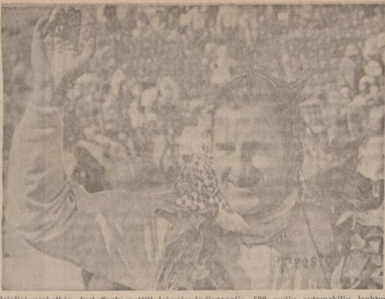
Oficialiai paskelbta, kad Graham Hill laimėjo Indianapolis 500 mylių automobilių lenktynes. Lenktynių metu eliminuota 15 mašinų.

nės į pietus iki Mozūrijos) buvo netoli 22-jo meridiano. 3) Nežiūrint aukščiau patiektų citatų didelio svorio, jos tačiau nenurodė anos "Prūsijos" apimties, kurios popiežius buvo savo metu Ordinui padovanojęs. Bet štai, 1257 m. pastarasis susitarė su čekijos karalium dėl Lietuvos užkariavimo. Vienualika metų vėliau, 1268 m., popiežius Kle-mensas IV patvirtino minėtąjį Ordino ir čekijos valdovo susitarimą. Jame popiežius rašė Ordinui: "Tas pats valdovas yra jums pažadėjęs, kad Prūsijos žemės dalys, kurias jūs ten įsigijote ir jau savo valdžioje turite, arba žemės dalys, kurios atsimitė nuo tikėjimo, bet kurias jūs kadaise savo valdžioje ir galioje turėjote, būtent: Kulmo, Lubovijos, Soysimo, Pamedžionių, Pazluko, Landeseno, Sambijos, Pagizionių, Varmijos, Nantango ir Bartos... niekas niekada to karaliaus ar jo įpėdinų vardu nesistengs sau priskirti... Šiose žemėse minėtasis karalius... pripažino neribotą bei laisvas jums jurisdikcijas, viešpatavimo, nuosavybės, valdymo ir įsigijimo visas teises, kurias ir anksčiau turėjote. O jūs jam pagal išgales padėsite įsigyti bei užimti Galindiją, Getvesiją, Lietuvą ir kitus Kristaus kryžiaus priešus." Popiežiai rūpestingai vengė tą patį kraštą dviem pretendantams užrašyti arba "dovanoji". Paskyrę Prūsiją Ordinui, jie dovanoto krašto apimtįs nebekeitė ir joks kitas suverenas (popiežiaus lenininkas) nebeturėjo teisių į tas žemes. (Bus daugiau)