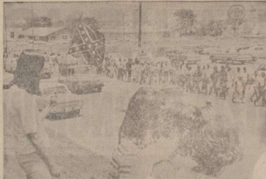
Mississippi negrai maršuoja pro Senatobia miesteli. Vietos gyventojai iškėlė konfederacinių pietinių valstijų vėliava.

Iš eilės einame prie didžiojo Greyhound autobuso, kurs minutė į minutę į Bučo daržą lygiai dvyliką valandą atvežė pilnutėli krovinį mielių svečių ir viešnių, sesių ir brolių rockfordiečių, o tie, vos iš buso išsiveržė ir etabuvę čikagiečių pasveikinti, beregint įsimaisė į anksciau atvažiuosiujų minčių ir pagyvino visą gyvenimą prie barų, kioskų, užkandinių ir geros parduotuvų. Rockfordiečiai šeiminiškės beregint užfiesė jiems rezervuotus ilgas stalus ir prasidėjo tikros lietuviškos vaišės, kur visiems perbaldas varvėjo, ir akys praregėjo!