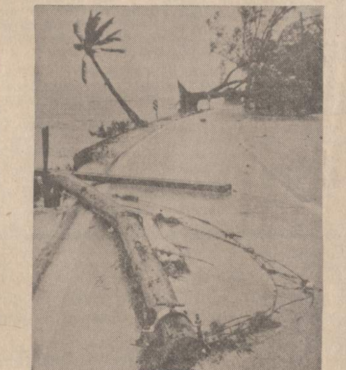
Šitai atrodė Key West pakraštys, kai pro jį praūžė uraganas Alma. Vejas ir lietus padarė didelių nuostolių Floridai.