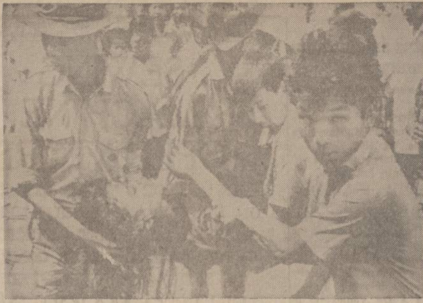
Saigono triukšmingų demonstracijų metu buvo sužeista jauna budistė triukšmadarė. Skautai neša sužeistą mergaitę į artimiausią pagalbos punktą.