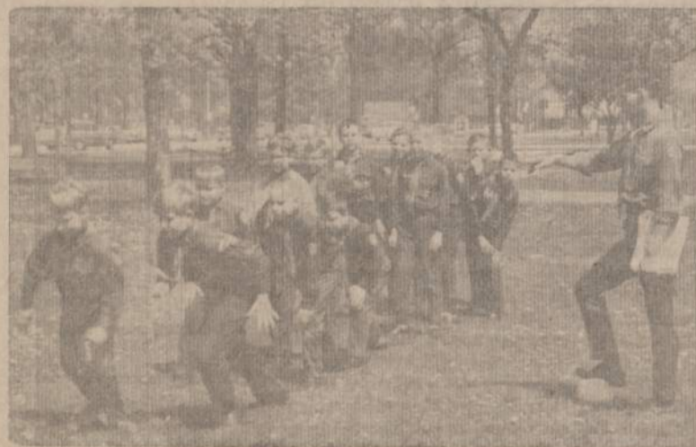
ŽAIDŽIA PATYS JAUNIAUSIEJI