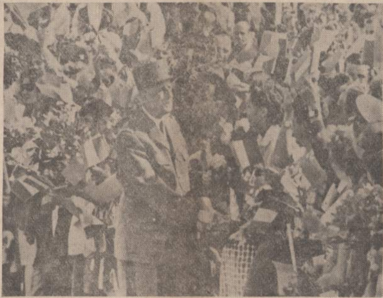
De Gaulle buvo sutiktas Maskvoje su gėlėmis ir vėliavomis.

Siandien de Gaulle išvyksta apžiūrėti Kijevo ir Novosibirsko.