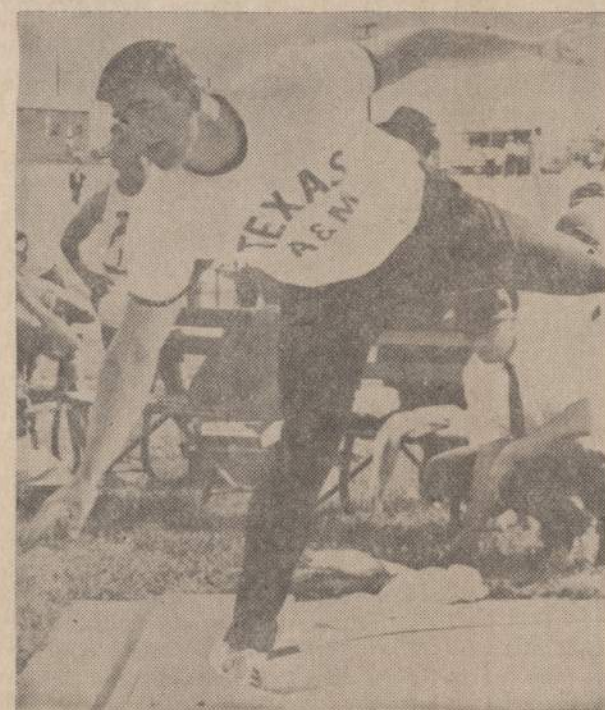
Bloomington, Ind., Indiano Universiteto suruoštos sporto rungtynėse Texas studentas Randy Matson toliausiai numetęs rutulį.