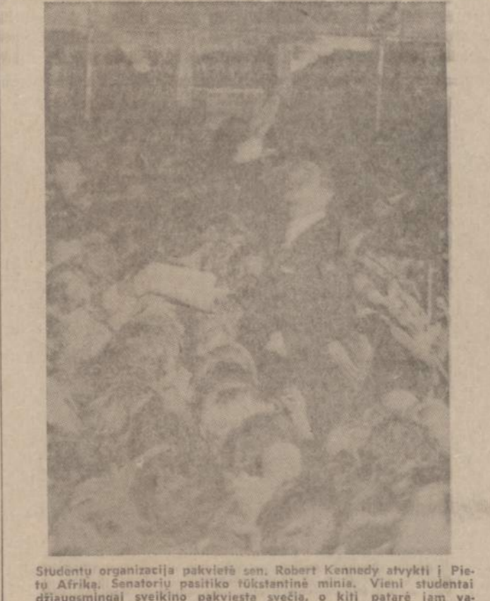
Studentų organizacija pakvietė sen. Robert Kennedy atvykti į Pietų Afriką. Senatorius pasitiko Tūkstantinė minia. Vieni studentai džiaugsmingai sveikino pakviestą svečią, o kiti patarė jam važiuoti namo.

„Dėl to, kad mano draugas leidimo neturėjo...“, gavo atsakymą.