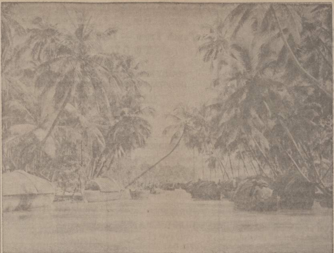
Indijoje, Kerala provincijoje, didesnių upių pakraščiai apsidinti paveiksle matomais sampanais. Jie tinka prekams pervežti, prekoms sandėliuoti, o dažnai ir žmonoms gyventi. Smarkaus lietaus metu upės pakyla. Aukštytyn pakyla sampanai, apsaugodami šeimas nuo lietaus ir nelaimių.