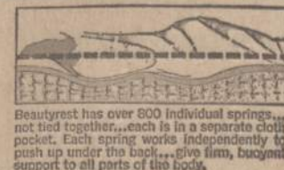
Beautyrest has over 800 individual springs... not tied together... each is in a separate cloth pocket. Each spring works independently to push up under the body... give firm, buoyant support to all parts of the body.