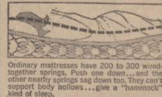
Ordinary mattresses have 200 to 300 wired-together springs. Push one down... and the other nearby springs sag down too. They can't support body hollows... give a "hammock" kind of sleep.