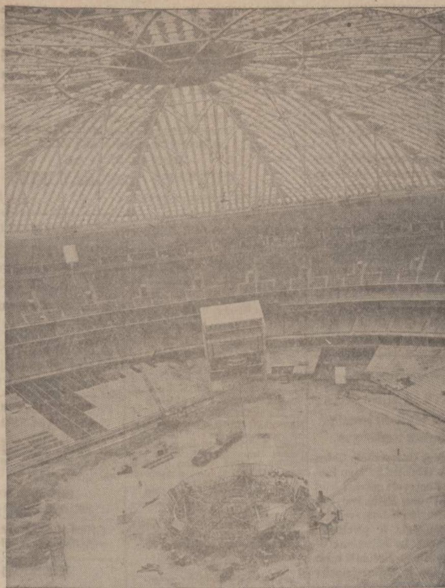
Houstone, Texas, pastatytas didžiausias futbolo - krepšinio sporto stadionas, visas po stiklo stogu.