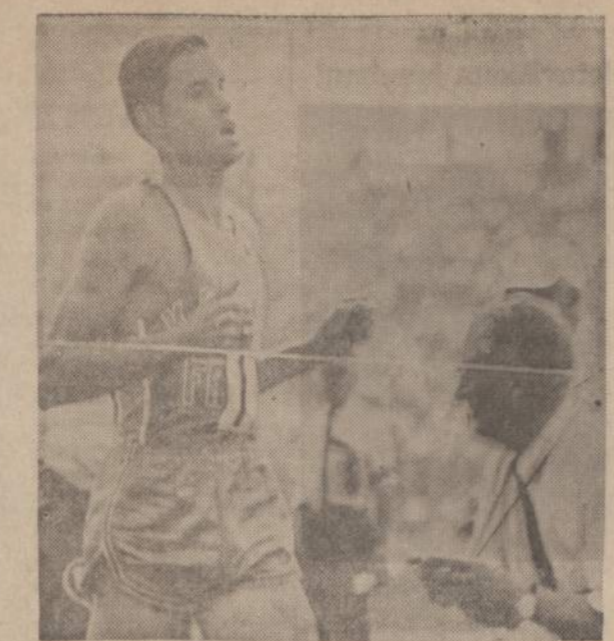
Kansas Universiteto pirmų metų studentas Jim Ryan pirma kartą sporto istorijoj nubėgo mylia į nepilnas keturias minutes. Niekas iki šio meto nepajėgė nubėgti mylios į nepilnas 4 minutes. Bėgimas vyko New Yorko lenktynių laukuose.

Visiems tiems leidiniams išleisti reikalingi pinigai. Todėl naujai paraginti knygų platintojai, kad jie imtųsi darbo daugiau