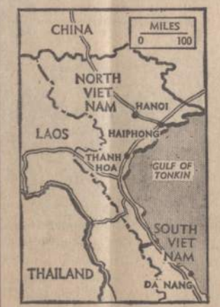
Amerikos karo lėktuvai bombardavo komunistų uostą Haiphong ir netoli Hanojo esančius gazolino tankus. Iš mestos bombos sukėlė labai didelius gaisrus.