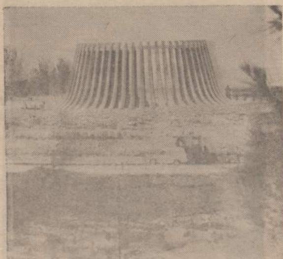
Izraelyje pastatytas paminklas žuvusiam JAV prezidentui pagerbti. Jis stovi 40 mylių atstume nuo Jeruzalės. Jis bus atidengtas liepos 4 dieną. Prie paminklo susirinks minios žmonių.