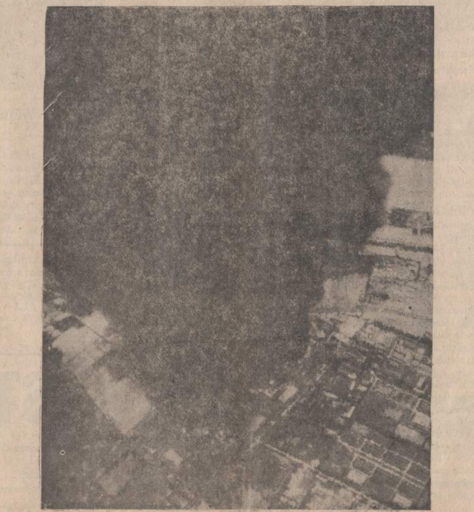
Amerikos karo lėktuvai bombardavo Hanojaus mieste buvusius gazolino tankus. Išmetus kelias galingas bombas, iškilio paveiksle matomi dūmų debesys.

Paskutiniu metu susikirtimai tarp protestantų ir katalikų Belfaste padažnėjo. Per kelias savaites žuvo trys žmonės.