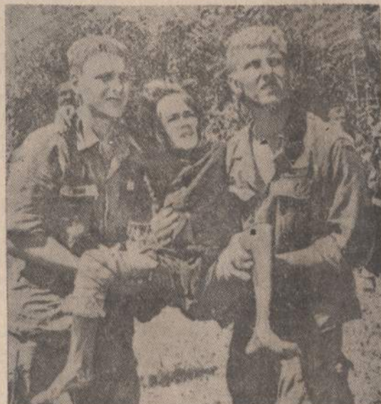
Tuy Hoa srityje įvyko smarkus susirėmimas tarp komunistų ir JAV karo jėgų. Mašiu metu nukentėjo 16 metų Vietnamo berniukas. Amerikos kariai neša berniuką į helikopterį, kad būtų nugabentas į užfrontes ligoninę.