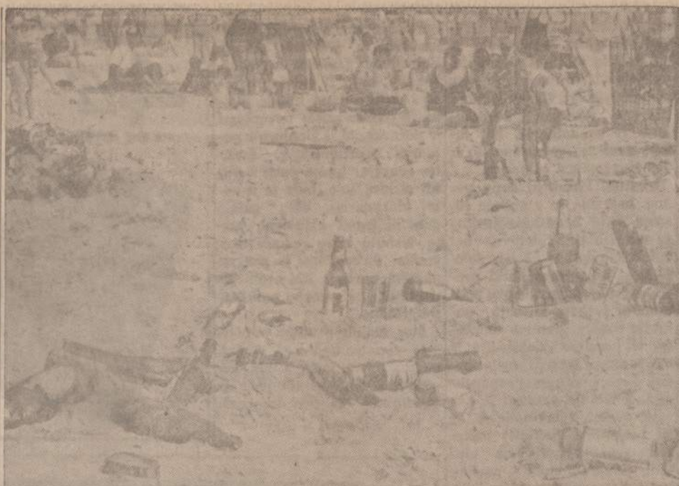
Brooklyno Coney Island paplūdimys šitaip atrodo, kai praėjo šios savaitės eventas. Valytojams teks daug dirbti, kol išvalys pajūrį nuo butelių ir stiklų.