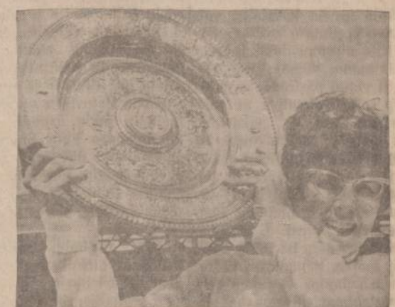
Ponia Billie Jean King laimėjo Pasaulio teniso čempionatą. Paskutinius tris metus čempionė buvo brazilietė Maria Bueno. Nauja laimėtoja, kilusi iš Alhambros, Kalifornijos, laiko iškėlusį laimėtoją trofėjų.