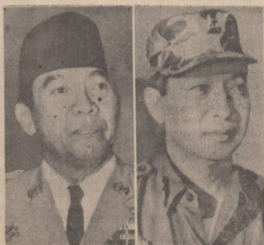
Indonezijos parlamentas atėmė iš prezidento Sukarno teisę būti prezidentu iki gyvos galvos. Parlamento viceprezidentu paskyrė gen. Sukarto (dešinė), kuris galės eiti prezidento pareigas, kai Sukarno negalės jų eiti.

Europos Bendrosios Rinkos steigimo metu britai jon stoti nenorėjo. Kada ji pareiškė norą prisijungti prie klestėti emušio rinkos, 1963 metais Prancūzija pareiškė savo veto. Reikia manyti, kad visi atsiradę pažiūrų skirtumai viename posėdyje nebus išspręsti, tačiau sprendimas artėja. Britanijai prisijungus prie Europos ekonominių ryšių, ateityje gali atsirasti ir politiniai ryšiai, kurie Europą padarytų trečiąja pasaulio galybe.