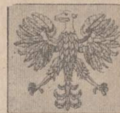
Oficialus komunistinės Lenkijos erelis.

Dailininkas Lewandoski aiškina, kad jis nepašė nei komunistinio nei kapitalistinio erelio, o tik stilizuotą Lenkijos simbolį. Lenkijos ambasada reikalaujant pakeisti pašto ženklo projektą, JAV valstybės departamentas ir pašto įstaiga atsisakė tai padaryti. Tada Lenkija pagrįsino, kad ji "pasilieka sau teisę neįsileisti į Lenkiją laišku ar siuntiniu, ant kurių bus priklijuotas tas pašto ženklas".