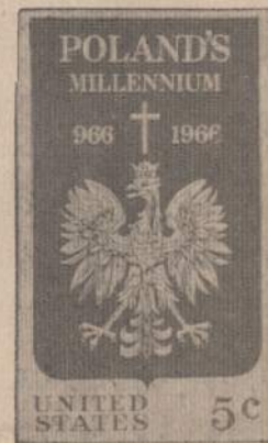
JAV pašto ženklas

Lenkija per savo ambasadą Washingtono išreiškė nepasitenkinimą, kad tame pašto ženkle vaizduojamas tradicinis lenkų erelis yra panašus į prieškarinį, "buržuazinės" Lenkijos erelį. Jis nešioja karūną ir neturi iškišęs liežuvio, kaip komunistinės Lenkijos erelis. Pati erelio forma irgi esanti sudarkyta.