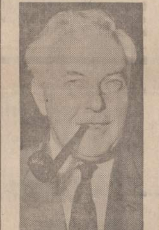
Britų premjeras prieš sėdintis Maskvoje, o liepos 29 d. skris į Washingtoną ir tarsis su prezidentu Johnsonu. Wilsonas remia prezidento Johnsono politiką Vietnamė. Keli parlamento nariai jį kritikavo. Klausimas buvo iškeltas darbičių parlamente tarpe. Už Wilsono ir Johnsono politiką pasisakė 246 darbičiai, o prieš pasisakė tikslai 46.