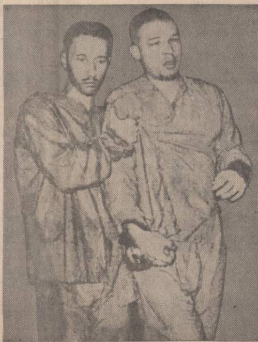
Komunistai tvirtina, kad paveikslė metomi du vyrai yra Amerikos lakūnai, patekę į komunistų nelaisvę. Komunistai rengiasi atiduoti juos karo teismui už žibalo atsargų sudeginimą.