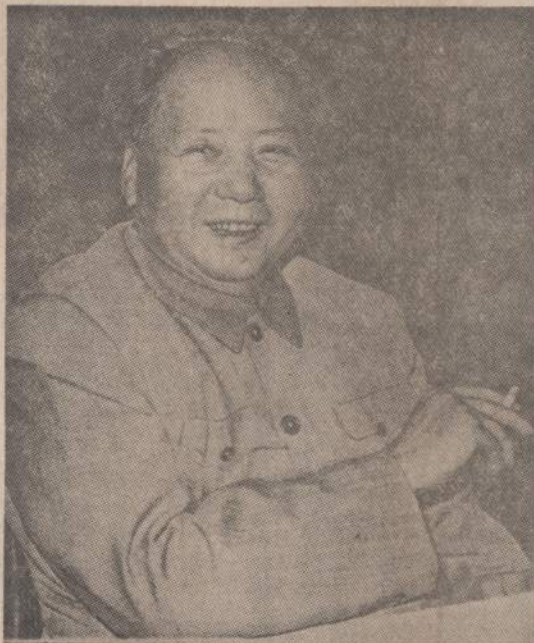
Laisvame pasaulyje buvo pasklidęs gandas, kad Maoceungas serga, kad Kinijos komunistai grumiasi dėl valdžios. Oficialiai paskelbta, kad ši fotografija imta birželio 23 diena. Ji yra Maoceungas atrodo sveikas ir stiprus. Politinius savo linijos priešus jis lengvai galės suvaldyti.

Pompidou pareiškė, kad dar nežinia, ar Britanija norės žengti tuo pačiu keliu, kaip Prancūzija ir priimti visus rinkos įsipareigojimus ir atsakomybę. Jei britai sutiktų tai padaryti, Prancūzija ją mielai sutiks bendroje rinkoje.