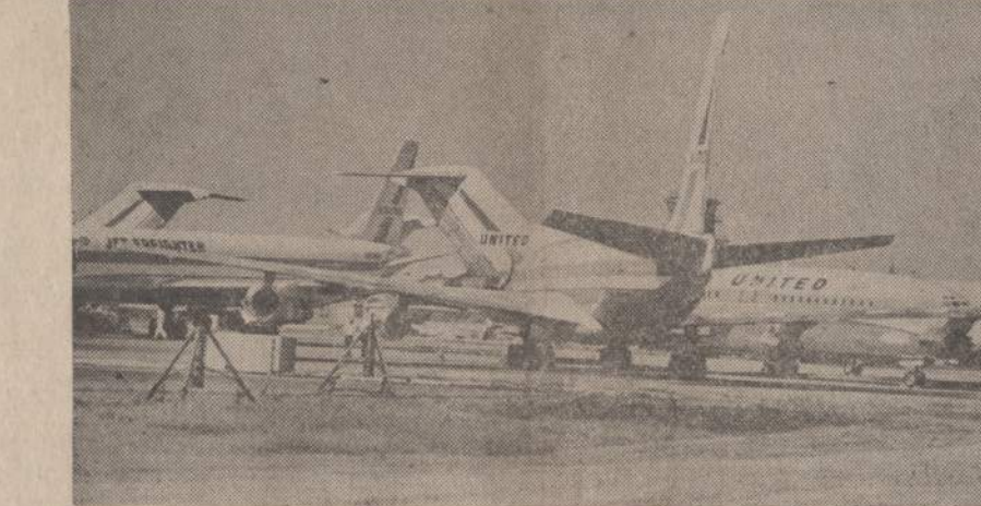
Sustreikavus lėktuvų mechanikams, tūkstančiai lėktuvų stovi aerodromuose. Paliestas 231 aerodromas ir veikia visos didžiosios transporto bendrovės. Apskaičiuojama, kad streikas sustabdė apie 70% keleivinių lėktuvų.

Streiko paliestos yra penkios didžiosios oro susiekimo bendrovės: United, Trans World, Northwest, National ir Eastern. Keturių tų bendrovių kasdien paima apie