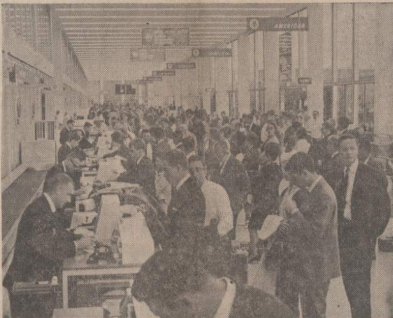
Sustreikavus aviacijos mechanikams, O'Hare aerodrome buvo didelis susigrūdimas, reikėjo grąžinti pinigus už tiketus.

Nuo Basanavičiaus paminklo delegatai buvo nuvesti į čiuurlonių namus. Ten buvo trumpas pobūvis, o vėliau visi išsiskirstė, kad galėtų ilsėtis ir antirdienio rytą svarstyti rimtesnius pasiūlymus organizacijos darbu pagerinti ir veiklai pagerinti.