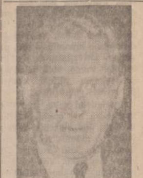
Amerikos aviacijai sunaikinus komunistų gazolino atsargas, Hanoi valdžia nesitiki pavergti Pietų Vietnamo, sako sekret. pavaduotojas George Ball.