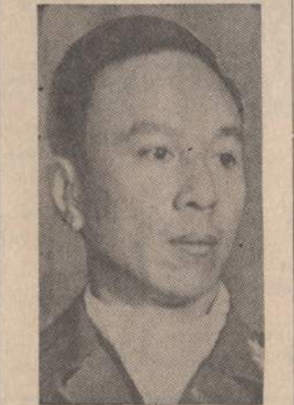
Vietnamo prezidentas gen. Van Thieu sako, kad karą lengviausia baigti įsiveržimu į šiaurės Vietnamą. Kai bus išnaikinti komunistų lizdai Vietname, nebūs iš kur išsiųsti karių į pietus. Amerikos karo vadovybė atsakė komentuoti apie prezidento pareiškimą.

ALŽIRAS. — Alžiro vyriausybė, kovodama su darbo federacijos opozicija, suėmė 36 unijų vadus.