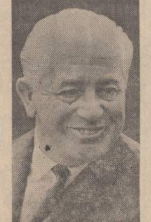
Australijos premjeras Harold Holt, išsikėlęs su britų premjeru Wilsonu, sustos Washington'e ir tarsis su prezidentu Johnsonu. Pasitarimuose bus liečiami Azijos reikalai.