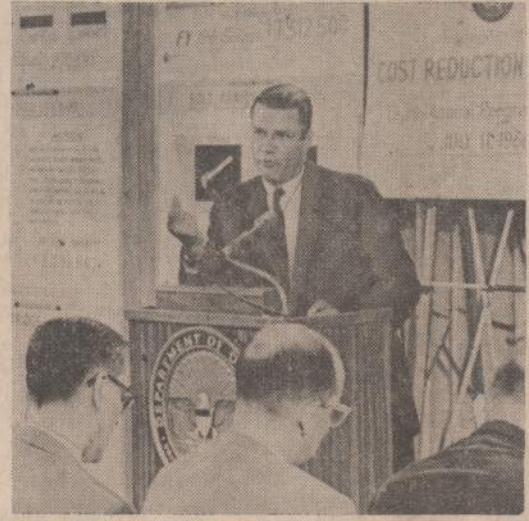
Krašto apsaugos sekretorius McNamara pareiškė spaudos atstovams, kad jo vadovaujamas departamentas pirmąs keturias metais sutarė 14 milijonų dolerių ir turi didesnes atsargas.

Prezidentas Johnsonas, kalbėdamas apie Kiniją, nurodė, kad be Kinijos taika Azijoje yra neįmanoma. Nedraugiška Kinija turi būti atgrasinta nuo agresijos, sukfaldinta Kinija turi būti padrasinta suprasti kitus pasaulio kraštus, padrasinta siekti taikingo sugyvenimo su kitais.