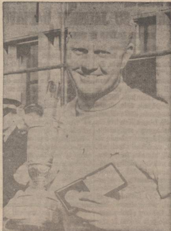
Golfo žaidėjas amerikietis Jack Nicklaus laimėjo britų golfo žaidynes. 4ki šio meto jis buvo laimėjęs kelias golfo rungtynes, bet Anglijoje jis laimėjo pirmą kartą.