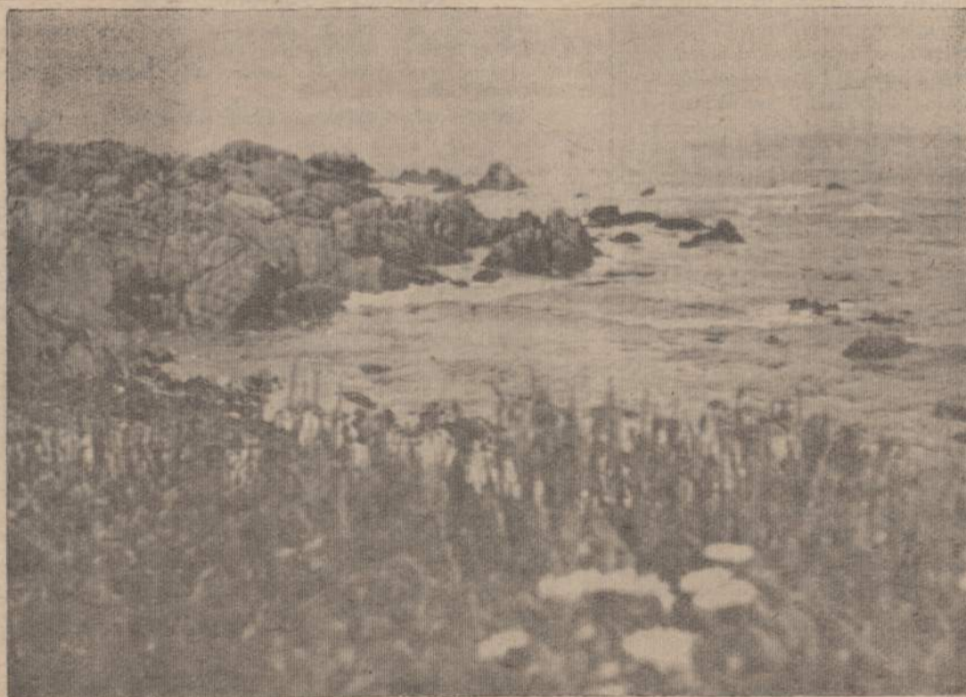
Pokis Joe, Calif. Aštūs akmenys neleidžia priplau ti pa. antę nei jūry lūtamis nei laukinams anštam.

— NAUJIENOS, CHICAGO 8, ILL. — SATURDAY, JULY 16, 1966