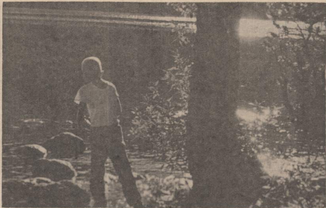
Saulėleidis prie ežero