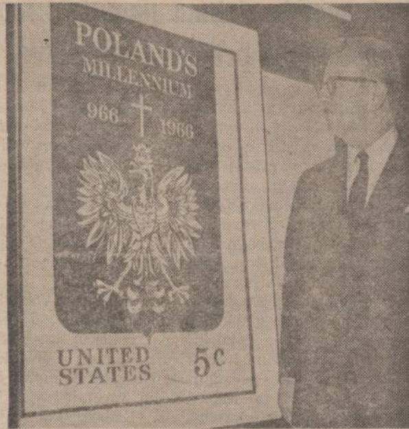
JAV pašto valdytojas Lawrence F. O'Brien žiūri į pagamintą pašto ženklą Lenkijos krikšto tūkstančiui metų paminėti. Manoma, kad dabartinė lenkų valdžia neįteis laišku su tokiais ženklais.

Labai šaunus “Aidų” siūlymas atsiliepia į nepriklaus-