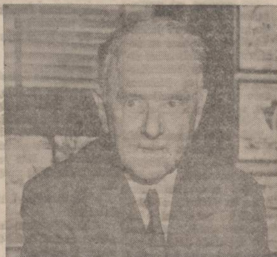
Buvęs sen. Harry F. Byrd, sulaukęs 79 metų amžiaus, sunkiai su-sirgo. Jo smegenyse atsirado votis. Byrd neteko sąmonės. Gydy-tojai nemano, kad sąmonę jis atgaus.