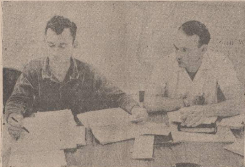
Jauni astronautai John Young ir Michael Collins tikrina paskutinius patvarkymus Cape Kennedy srityje. Liepos 18 dieną jie rengiasi pakilti į orbitą, o liepos 21 nusileisti. Astronautas Collins planuoja pavaikščioti apie valandą erdvėje.

HAMBURGAS, V. Vokietija. — Rytinės, komunistinės Vokietijos karinis sargybos motorlaivis Elbės upėje pagrobė Vakarines Vokietijos muitinės laivuką, kai šis, motorui sugedus, turėjo sustoti plaukęs. Elbės upė skiria Vakarų Vokietiją nuo Rytų Vokietijos. Kai vakariečių mechanikai norėjo priplaukę laivuko motorą pataisyti, komunistai atsuko į juos kulksvaidžius ir viršum galvų paleido keletą salvių. Kiti raudonieji pasieniečiai, kulksvaidžių priedangoje, sulipę į laivelį, jį nusitempė į raudonąją zoną. Vakariečių protestai liko be pasekmių.