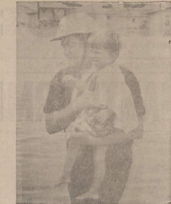
Liepos 12 dieną Sandusky, O., miestelyje per kelias valandas iškrito net 9 coliai lietus. Vanduo apėmė svarbesnes gatves ir namus. Paveikslė matome policininką, nešantį vaiką iš apsemti namo.