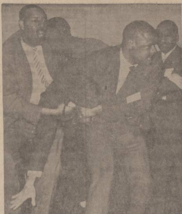
Šiominis dienos Los Angeles, Calif., mieste vyksta neigru organizacijos konferencija, besirūpinanti neigru gerbūviu. Konferencijon įsivertė vienas Amerikos nacių partijos narys ir pradėjo šaukti prieš neigrus ir žydus. Jis tuojau buvo suimtas ir iš konferencijos salės išvestas.

RADIJO SEIMOS VALANDOS Visos programos iš WOPA, 1490 kil. A. M. Lietuvių kalba: kasdien nuo pirmadienio iki penktadienio 10-11 val. ryto. — Šeštadienį ir sekmadienį nuo 8:30 iki 9:30 val. ryto. Vakaruokos: Pirmadieniais 7 v. v. Tel.: HEMlock 4-2413 7159 So. MAPLEWOOD AVE. CHICAGO, ILL. 60629