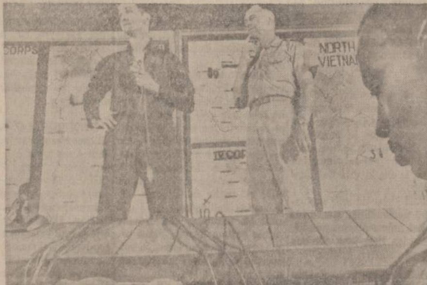
Liepos 1 dieną Tonkino įlankos vandenyse trys komunistų torpediniai laivai puolė JAV karo laivą Coontz. Tuojau buvo iškvieisti JAV lėktuvnės įgys naikintuvai, kurie nuskandino visus tris komunistų torpedinius laivus.