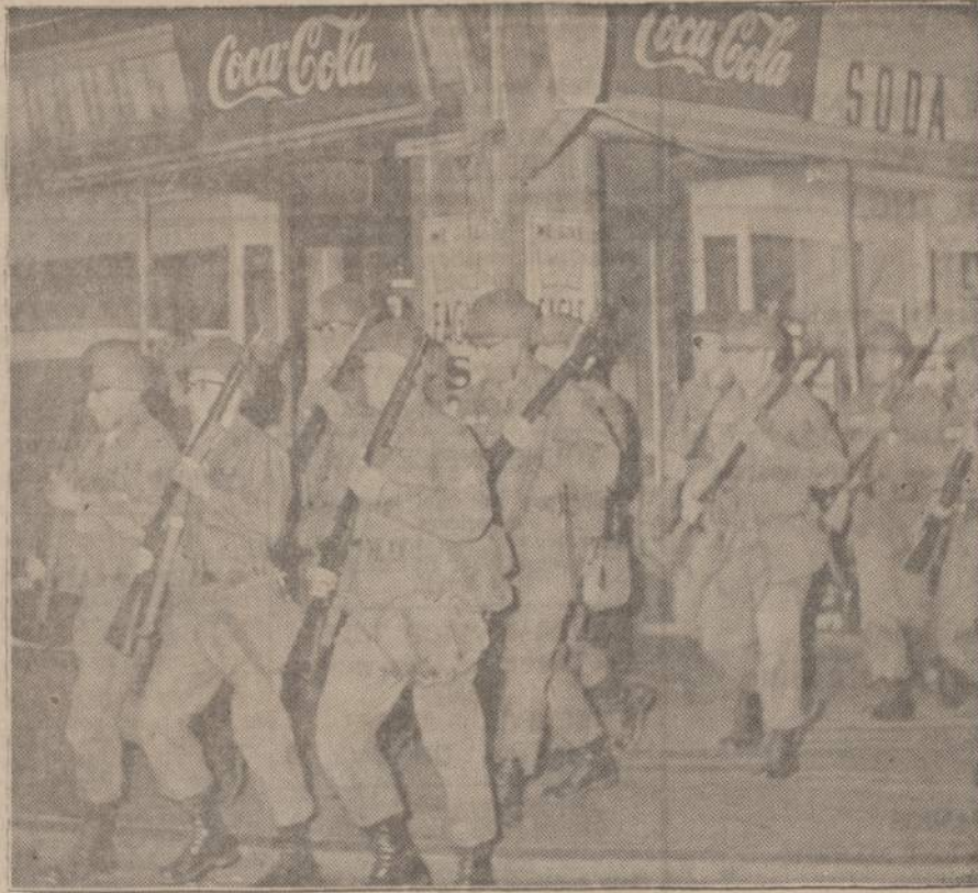
Ohio nacionalinė gvardija žygiuoja į Clevelandą tvarkos palaikyti. Organizuota Clevelando negro grupė padegė 10 namų dviejuose distrikčiuose ir padėjo dinamito biznio įstaigose.

GYDYTOJAS IR CHIRURGAS Bendra praktika, spec. MOTERŲ LIGŲ Ofisas: 2652 WEST 59th STREET Tel.: PR 8-1223 OFISO VAL.: pirmadienį, antradienį, trečiadienį, penktadienį ir 6-8 val. vak. Šeštadieniais 2-4 val. po pietų ir kitu laiku pagal susitarimą.