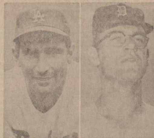
Sandy Koufax (kairė) ir Dennis McLain — geriausi sviedėjai Amerikos sportininkų tarpe.