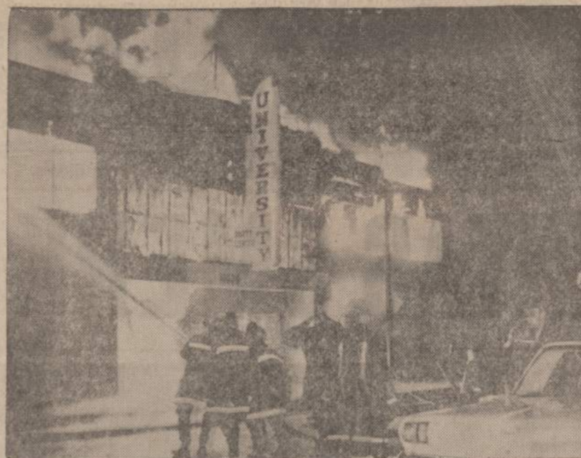
Tris naktis Clevelande negrai degino namus ir įvairias įstaigas...