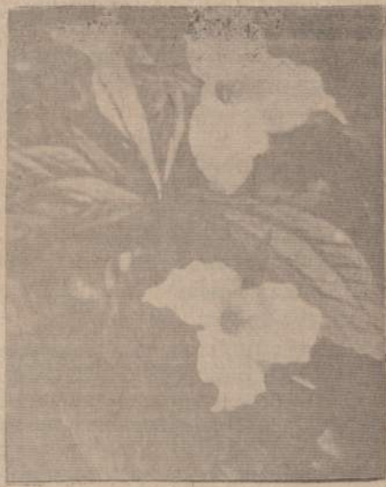
Trilijonas, pavasary žydi miškuose. Baltas, su gelsvu viduriu žiedas, panašus į baltos lelijos žiedą.

Ežeras kartais ramus ir šiltas, kartais bauginančiai smarkus, pasišaušęs. Išmeta ant kranto tūkstančius negyvų žuvelių. Laksto musės birbdamos, čiulpia išlūžusius vandens gyventojų kūnus, nešioja bakterijas. Neturi laiko niekas tų žuvų, kad ir neiškilmingai palaidoti. Vasarotojai patys čia pat į smėlį užkasa, jei atsiranda tokių darbsčių ir energingų. Tinginiai toliau į krantą pasitraukia. Sako — gerai tos žuvis. Musės ant mano kremu taip nepuola.