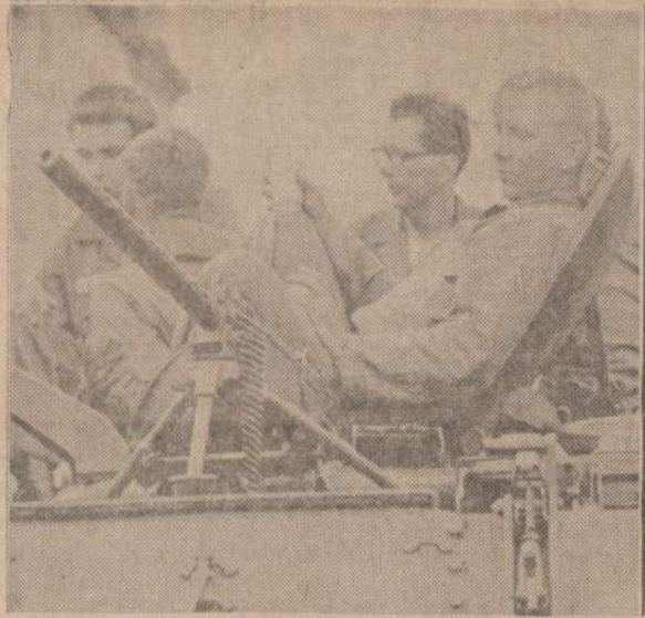
Tautinės gvardijos nariai praleido ramų savaitgalį Clevelande, kur per kelias dienas vyko rasinės riaušės.