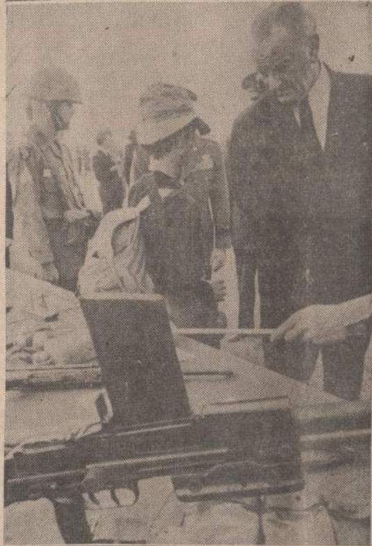
Prezidentas Johnsonas aplankė Fort Campbell (Ky.), kur jam buvo parodyti iš Vietnamo komunistų partizanų (Viet Cong) atimti ginklai.

savo pačių minomis sužeisti. Iš to skaičiaus apie 20% neteko kovoti.