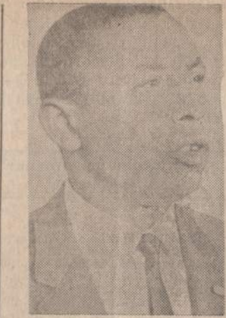
Floyd B. McKissick, Rasinės lygybės kongreso direktorius, vyksta į Kongresą Amerikos pranešimais, kad Vietnamičiai, esą, išstiprūs, kiek yra pacong (komunistų partizanai) operuoja iš Kambodijos. Kiek tas tyrimas bus beaiškias, galima spręsti iš to, jog McKissick iš anksto yra pareiškęs, kad jis abejoja Amerikos pranešimais.

Per riaušes 61 policininkas buvo sužeisti, iš jų 19 dar tebegydomi. Aštuoni policininkai sužeisti kulkomis, 21 metais daiktai, kaip tai akmenimis, plytomis, bonkomis, 7 su-