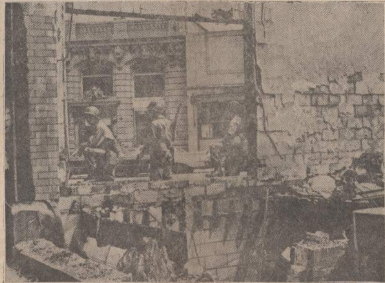
Clevelando rasinėse riaušėse šis namas buvo sugriautas. Pasitiko siena su langais, prie kurių stovi milicininkai.

PEKINAS. — Sovietų užsienio reikalų ministerio Gromykos Japonijoje vizito proga komunistinė Kinija skelbia, kad Gromyko užbaigė "šventą, priešrevoliucinę santarvę tarp Amerikos, Japonijos ir Sovietų Sąjungos".