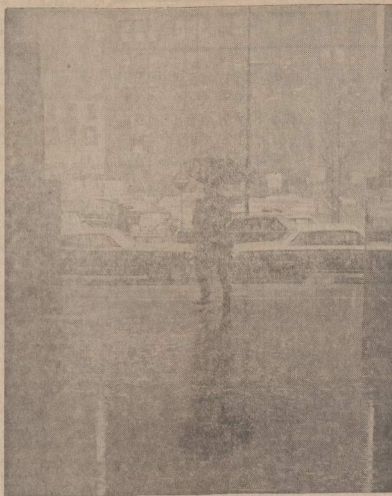
Ši nuotrauka buvo nuimta lietingą dieną New Yorke. Ji būdinga tuo, kad matosi lyg saulės apšviestas ruožas.