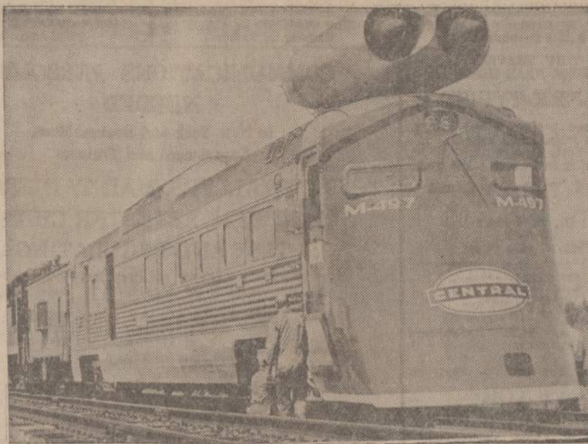
New York Central geležinkelis rengiasi pradėti "sprausminį amžių" su naujos rūšies lokomotyvu. Bandomasis lokomotyvas jau padarytas ir Bryan, Ohio, su juo yra daromi tyrimai. Jo greitis busias 225 mylios per valandą. Bandomuose jau pasiektas 195 mylių per valandą greitis. Lokomotyvu yra naudojami sprausminio lektuvo motorai.

BIZNIERIAI, KURIE GARSINASI "NAUJIEŅOSE" — TURI GERIAUSI — GARSINKIS IR TU PASISEKIMĄ BIZNYJE