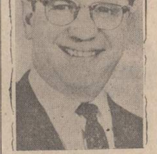
Senatorius Vance Hartke (demokratas iš Indianos) pareiškė, jog Anglijos premjero atsilankymas yra susijęs su britų valiutos smukimu. Esą, Amerikai tai turėtų būti pamoka, kad reikia daryti pagrindinių reformų laisvojo pasaulio pinigų politikoje.

♦ Nigerijoje sudaryta nauja karinė vyriausybė, kuri tvirtina, kad dabartinis sukilimas siekia užkirsti kelią civiliniam karui tarp Nigerijos musulmų ir krikščionių.