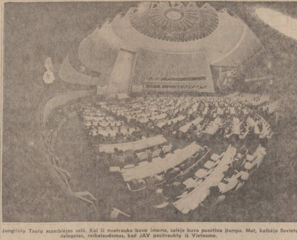
Jungtinių Tautų asamblėjos salė. Kai ši nuotrauka buvo imama, salėje buvo pusėtina įtampa. Mat, kalbėjo Sovietų delegatas, reikalaujamas, kad JAV pasitrauktų iš Vietnamo.