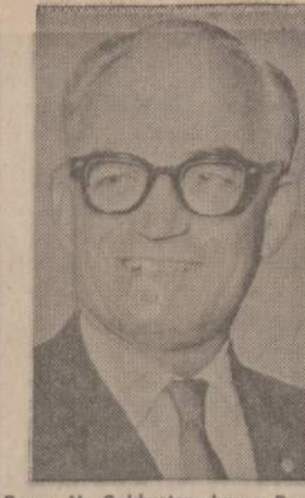
Barry M. Goldwater, buvęs Respublikonų partijos kandidatas prezidento postui, ragina prezidentą Johnsoną aplankyti didžiulius miestus ir panaudoti savo įtaką rasinei įtampei sumažinti. Eisa, rasinė problema pranyktų, jei visos rasės gyventų kaip krikščionys.

Pabėgėlis iš Bulgarijos pareiškė, kad bulgarai buvo istoriškai Rusijos draugai. Bet prievarta užkarts jiems komunizmas pavertė juos prie-