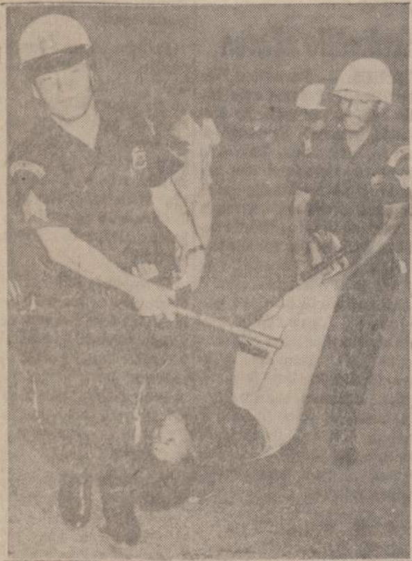
North Amityville, N. Y. — Policininkai neša negro, kuri pasižymėjo aktyvumu liepos 28 d. surengtose rasinėse riaušėse.

BUS ĮDOMI PROGRAMA, GERA MUZIKA ŠOKIAMS, SKANUS MAISTAS IR LABAI GERI GERIMAI. VISĄ LAIKĄ GYVAS IR GARSUS ORKESTRAS GROS POLKAS, VALSUS IR PAČIUS MODERNIŠKIAUSIUS ŠOKIUS JAUNIEMS IR VYRESNIEMS. RUGPIUČIO 21 D. VISI KVIEČIAMI Į NAUJIENU PIKNIKĄ.