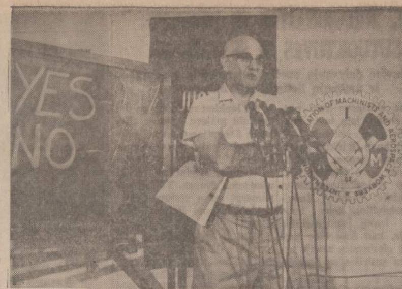
Aviacijos penkių bendrovių Mašinistų unijos nariai nubalsavo nepriimti jų vadovybės parengtą sutartį su bendrovėmis (tarpininkaujant prezidentui Johnsonui) sutarties. Prieš sutarties priėmimą balsavo 75 nuomčiai.

Spaudoje pasirodė žinia, kad netrukus būsiąs pašalin-