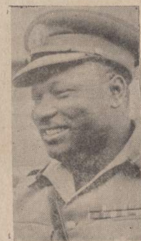
Generolas Johnson Aguiyi-Ironsi, kuris buvo Nigerijos sukilėlių pagrobtas ir jo valdžia nuverstas.

FALMOUTH. — Prie pietinės Anglijos krantų dingo jūroje ekskursinis laivas su 31 keleiviu.