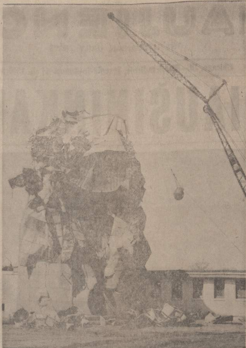
Griovėjams teko sunkiai dirbti, kol nuvertė plieno ir mūro silo, pastatytą žiemos pašarui ruošti. Paveikslo matome iškeltą plieno rutulį, kertantį į silo šoną.