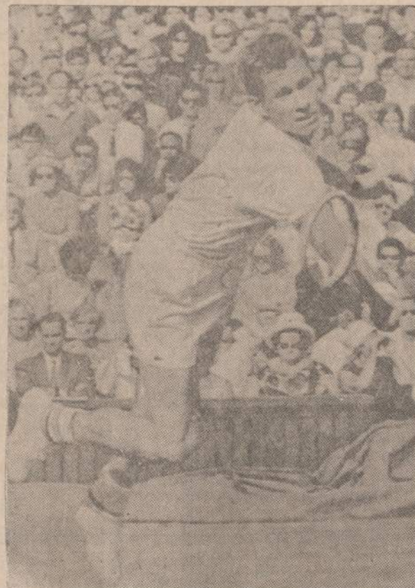
Rugpjūčio 13, 14 ir 15 dienomis Clevelande vyks geriausių teniso žaidėjų rungtynės. Amerikos, Ispanijos, Meksikos, Brazilijos ir kitų valstybių čempionai persikirs. Paveiksle matome amerikietį Dennis Ralston.