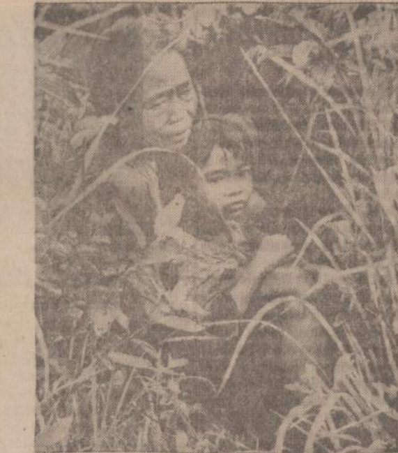
Vietnamo moteriškė su savo anūke išbėgusi į laukus ir pasislėpusi žolėje. Prasidėjus kovoms Chu Lai apylinkėse, gyventojams teko bėgti į laukus, nes kaimai buvo naikinami.

Be vienbalsį sprendimą pasiekti dažnai būna sunku, kartais neįmanoma. Užtenka tik vieno džiūres narį papirkti arba įbauginti, kad nusikaltėlis išsisuktų. Norėdama pa-