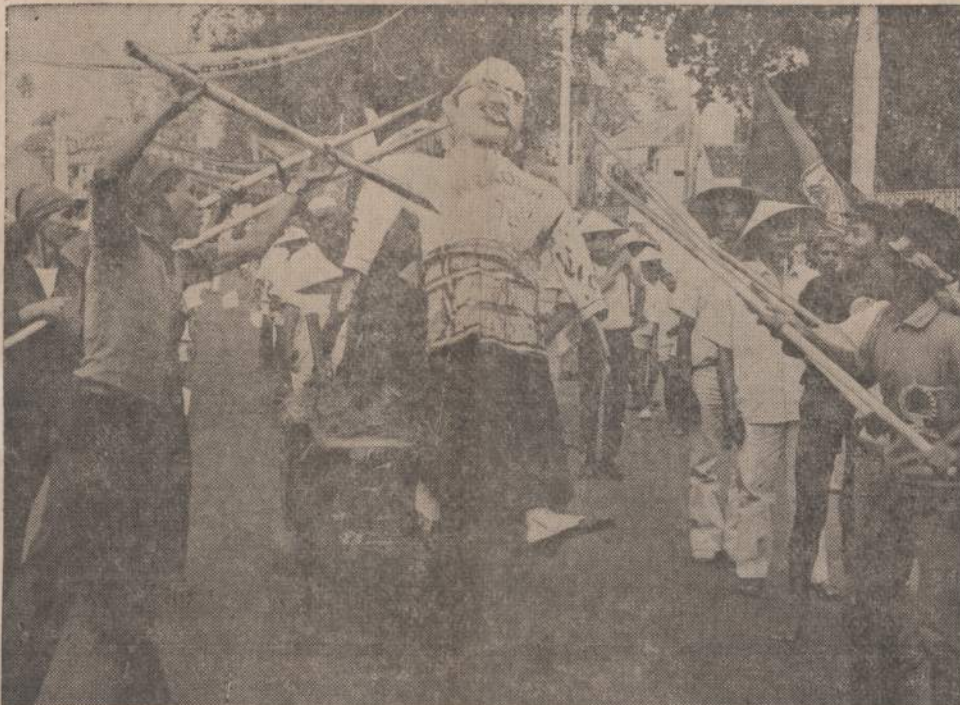
Indonezijoje, Džakarta mieste, nacionalistų partijos atstovai protestuoja prieš Malaizijos premjera Abdul Rahman. Protesta jie reikią stipriomis bambuko lazdomis. Nauja Indonezijos valdžia nenori kovų su Malaizijos valstybių sąjunga, bet nacionalistai nepatenkinti šia vyriausybės politika.

WASHINGTONAS. — Draudimo bendrovės praneša, kad Amerikoje yra apie 9 milijonų našlių. Iš 8 Amerikos moterų viena yra našlė.